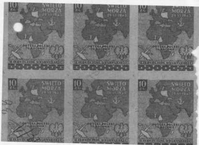
Fot. 2. Znaczkę wydawane przez „Miecz i Plug”.

Kontakt z Włocławkiem placówka utrzymywała przez Szewczykowskiemu lub łącznika „Janka” (NN). Na teren Ślesina przywożona gazeta „MiP”.