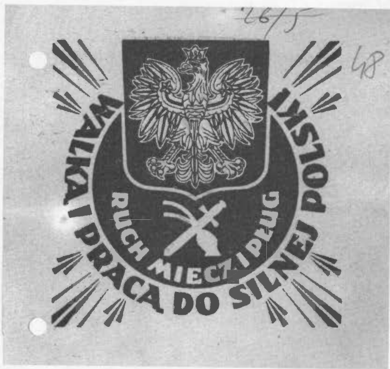
Fot. 1. Emblemat „Miecza i Pługa”, ze zbiorów Autora.

nikiem skupiającym w swym ręku sprawy cywilne i wojskowe organizacji został Słowikowski. Po utworzeniu Rady Naczelnej jej Przewodniczącym mianowano ks. Poeplau, a jego zastępcą Słowikowskiego.