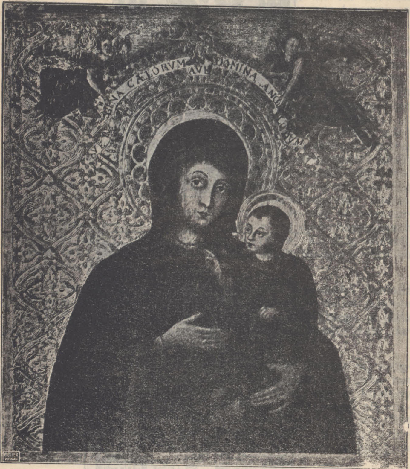
— Cudowny obraz Matki Boskiej w Borku na Zdzieżu. —