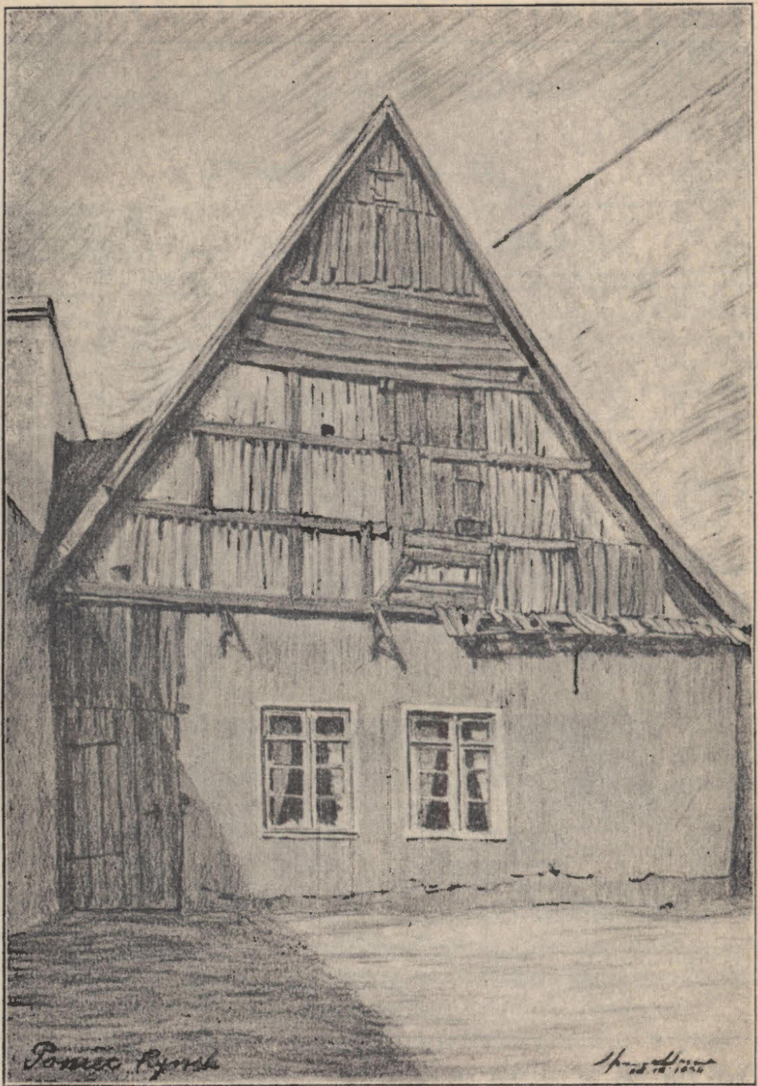
Widok domu z podcieniem w Poniecu od podwórza. (rys. Karol Prausmüller).