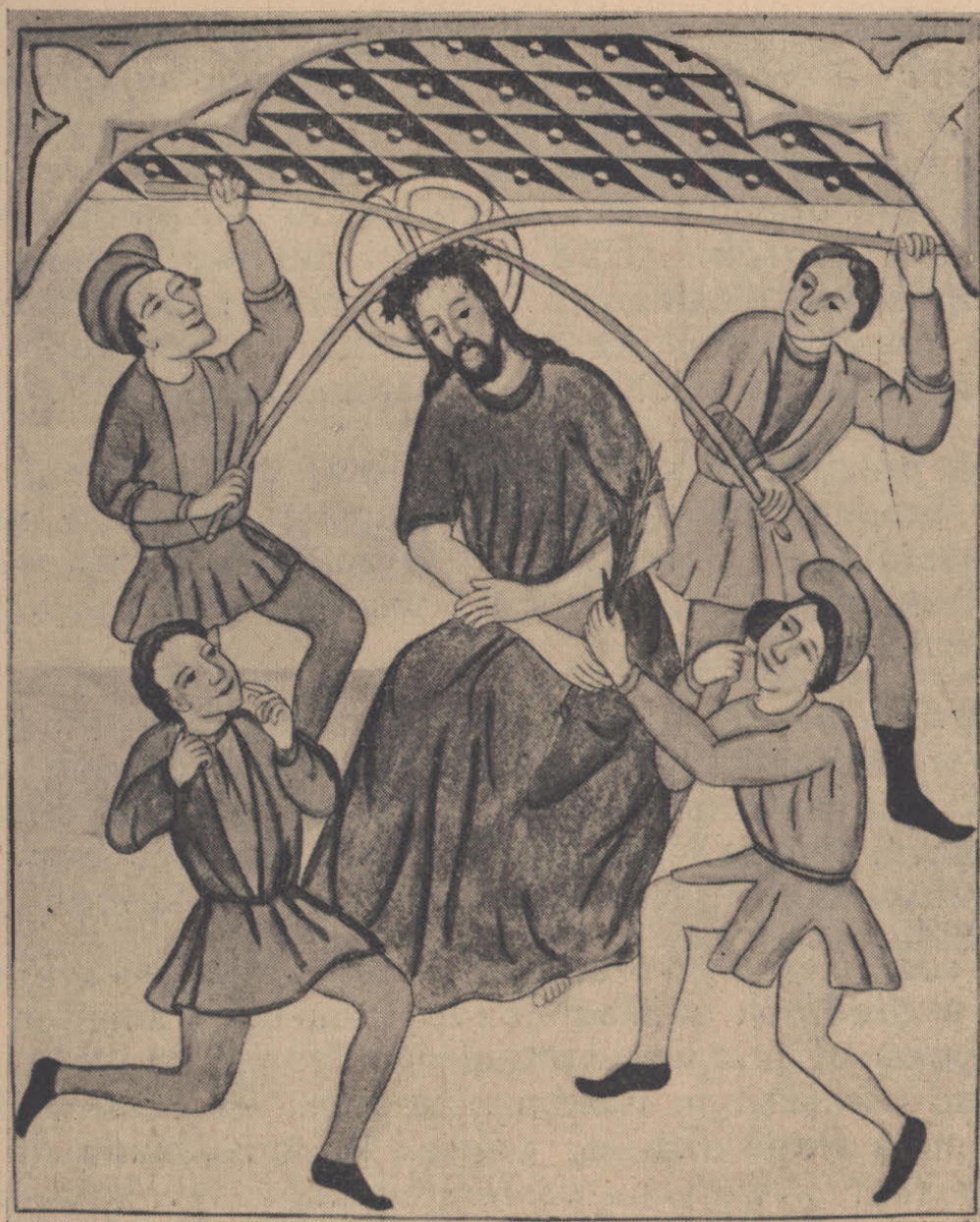
Średniowieczny obraz ścienny w prezbiterium farnym. (rekonstrukcja z r. 1901).

zmiernie oryginalną. Olbrzymia, wyłobiona w jednym pniu drzewa, na kształt łodzi, wylana żywicą — trzymała się doskonale, jakby dopiero co wyszła z warsztatu. Wewnątrz znajdował się szkielet olbrzymiego mężczyzny, okryty jakimś długim płaszczem z doskonałego materiału, ponieważ zachowany był świetnie; na zewnątrz niebieski, wewnątrz czerwony. Były na nim ślady niegdyś przyszytych guzów. Musiał to być jakiś posesjonat, widać bowiem było, iż ongiś biodra jego otaczał szeroki pas — bodajże z karabelą. Niestety pasa już nie było, ani żadnej kosztowności; wszystko znikło — być może uniesione przez złodziei. Kim był ów nieboszczyk — nie wiadomo. Nazwiska nie było.