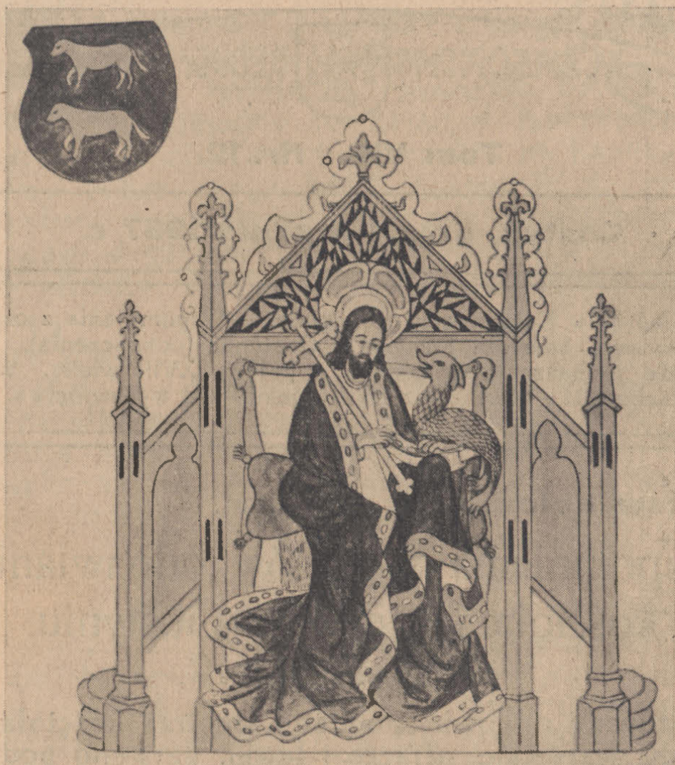
Średniowieczny obraz ścienny w prezbiterium farnym. (rekonstrukcja z r. 1901).