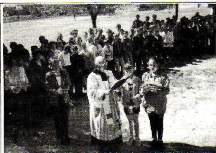
Poświęcenie wybudowanej części szkoły