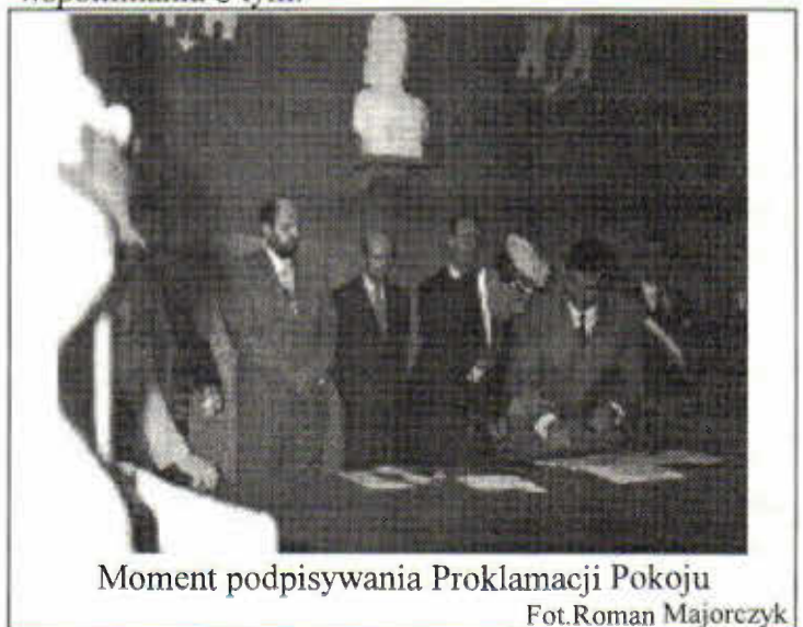
Moment podpisywania Proklamacji Pokoju

Poprzedni rok 1994 - czerwiec i obecny rok 1995 - 8 maj zamknęły się okrągłą liczbą 50. Pierwsza data - 50 lat od bitwy o Normandię i druga 50 lat od zakończenia wojny. Dzień 8 maja 1995 roku stał się w Vire pierwszym dniem „Tygodnia Pokoju”. Zaproszone delegacje z Anglii, Stanów Zjednoczonych, Polski (delegacja z Krzywina) , Belgii, Hiszpanii, Rosji i Niemiec miały rozpocząć dzieło pokoju na nowo, by trwał bez względu na różne wydarzenia, prowokacje, dyskusje polityczne. Jest to wartość tak ważna, iż nigdy nie jest za dużo wspominania o tym.