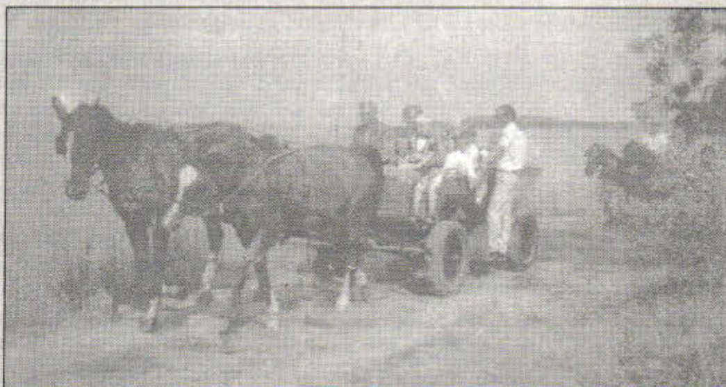
Przejażdżki powozami podczas festynu z okazji Dnia Dziecka.