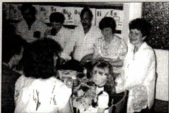
Z Dnia Matki w Przedszkolu w Bieżyniu