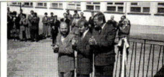
Tuż po przecięciu wstęgi...