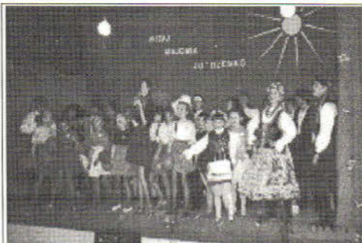
Występy dzieci szkolnych