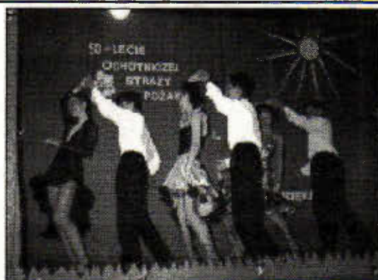
Migawki z 50 lecia OSP Bieżyń