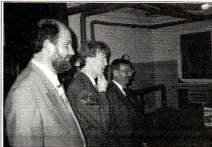
Goście zwiedzają kotłownię