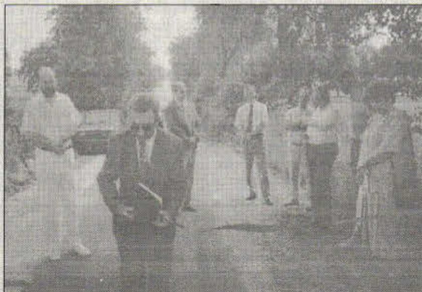
Otwarcie drogi z Czerwonej Wsi do Kuzzkowa