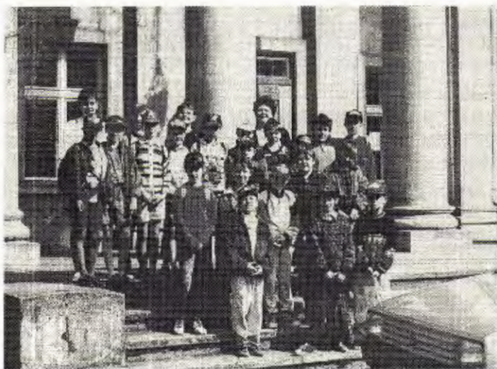
Szlak rozpoczynał się przed pałacem w Kopaszewie....

20 maja boisko Szkoły Podstawowej w Jerce zaroilo się młodymi, ubranymi w sportowy strój ludźmi. Szli lub jechali rowerami od strony Świńca, mijali bramę szkoły z napisem META RAJDU, meldowali się na mecie, odbierali plakietki, dokonywali wpisów punktów na odznaki turystyczne.