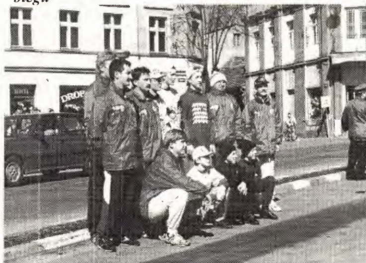
Pamiątkowe zdjęcie uczestników biegu na rynku w Krzywiniu

W trzydziestoosobowej grupie biegnących z pochodnią znaleźli się uczniowie szkół pod-