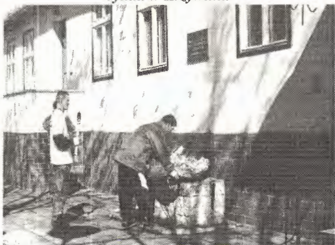
Złożenie kwiatów pod tablicą upamiętniającą udział Krzywiniaków w Powstaniu Wlkp