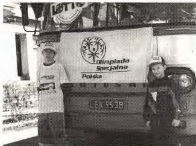
Tak wyglądał autokar towarzyszący uczestnikom biegu