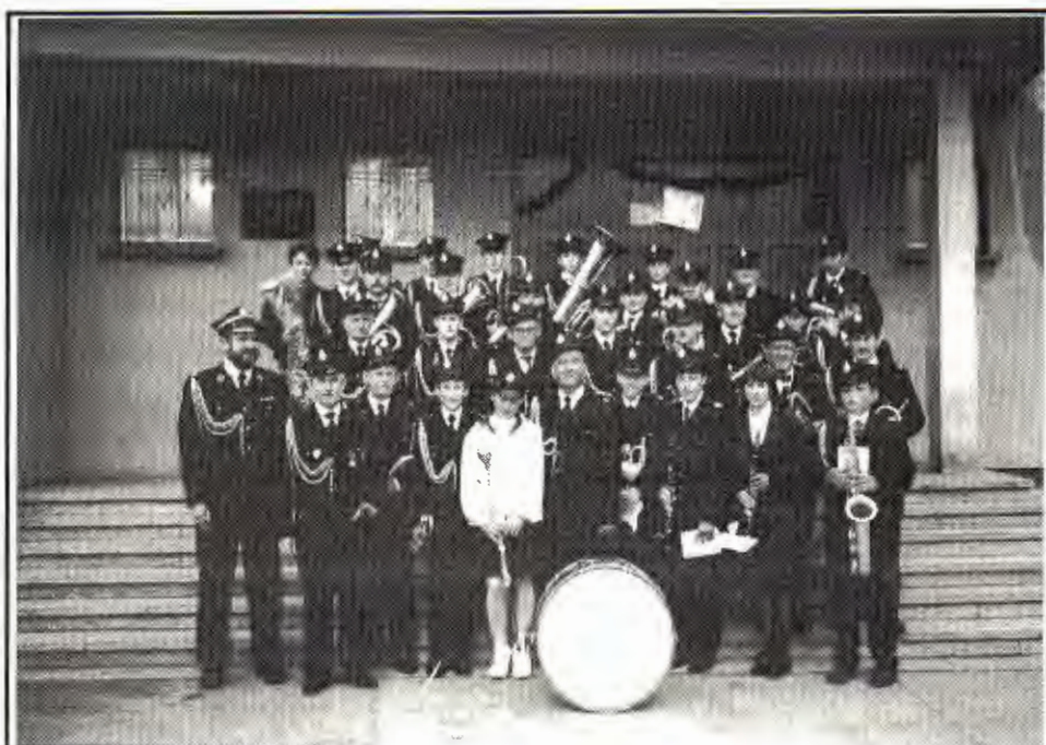
Orkiestra Dęta OSP Krzywiń przed Domem Strażaka, 4.V 1996 r.

Sprawozdanie z działalności Zarządu str. 7