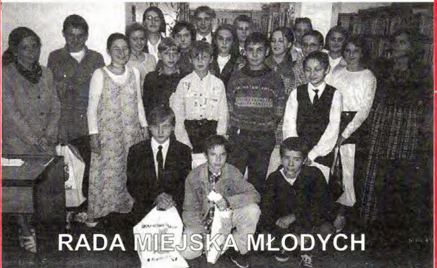
RADA MIEJSKA MŁODYCH