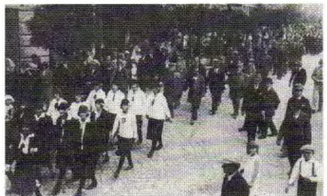
Delegacja Gniazda Krzywiń