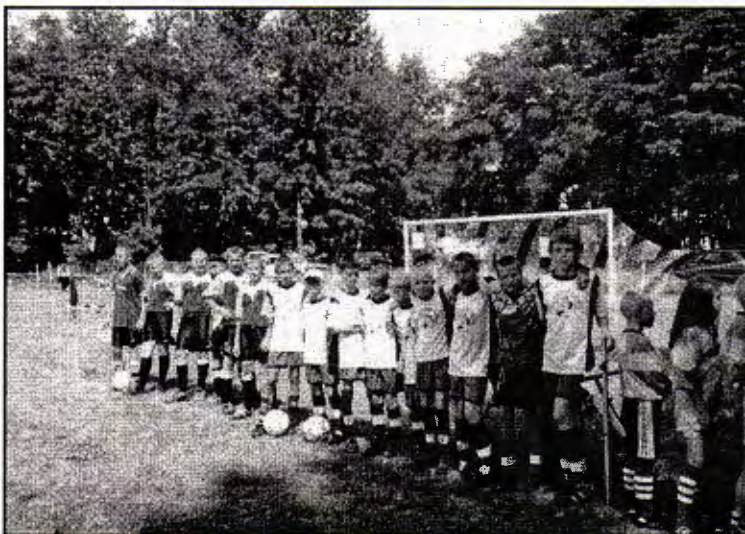
Fot. LZS 0001 Migawka z turnieju piłkarskiego „Wakacje na Sportowo”, który odbył się w Łuszkowie. Na pierwszym planie część drużyny Bielawa, w środku drużyna „Konieczny” Krzywiń oraz drużyna Łuszkowa.

Bielewa przed Łuszkowem i Krzywiniem. W meczach piłki nożnej seniorów drużyna Gmina Krzywiń zwyciężyła Alplast Nockowo 3:0 oraz Nieślabin gm. Śrem 4:3. Ponadto dla dzieci zorganizowano 4 konkurencje rekreacyjne oraz dla rodzin, w których startowała mama + tata + dziecko rzut łaczkim, beretem i podkową. Nagrody ufundował Urząd Miasta i Gminy Krzywiń.