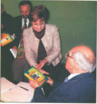
Autor składa dedykacje

Spotkanie z autorem miało charakter wyjątkowy. Wzięło w nim udział ponad 70 zaproszonych gości. Wójt Gminy