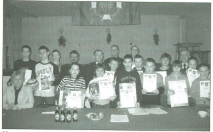
Uczestnicy i organizatorzy Konkursu „Młodzież zapobiega pożarom”