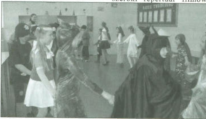
Balik karnawałowy klas I-III

Gminny Ośrodek Kultury w Lipnie zaprasza na