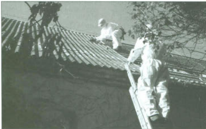
Ściąganie płyt azbestowo-cementowych z budynku gospodarczego w Wilkowicach