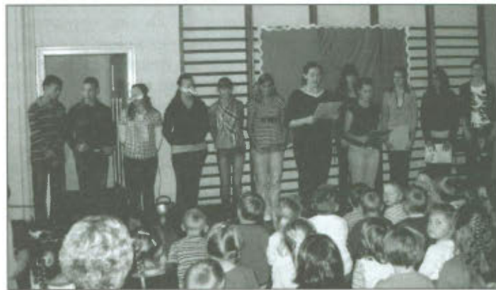
Młodzież gimnazjalna w Przedszkolu w Radomicku

stawia (10.10.2008) w Przedszkolu w Lipnie. Dzieciaki z dużym zainteresowaniem oglądały nasze występy. Wszystkim podobała się inscenizacja o dzieciach jadących przez BRUDNY świat. Największym hitem jednak okazała się wspólna zabawa w naśladowanie głosów zwierząt. Po występach przedszkolaki zdali egzamin na „CZYŚCIOCHA” i zostały obdarzone upominkami, które zebraliśmy wspólnie (wielu uczniów przyniosło własne zabawki). Na zakończenie wspólna zabawa i... aż żal by-