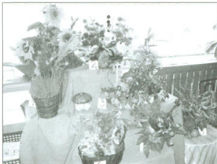
Bukiety i kompozycje jesiennie wykonane przed przedszkolaków razem z rodzicami