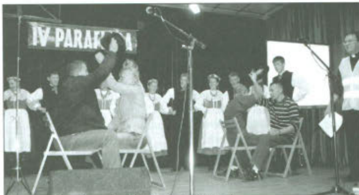
Zabawa z kapelusznymi „Pije Kuba do Jakuba”

komandosów. Podwórze GOK-u należało do tych, co mieli „sokole oko”, by lotką czy wiatrówką trafić „10”. Dobrze nasmarowane musiało być koło naszego „Casyna”, bo kręciło się na okrągło uszczęśliwiając milusińskich ciekawymi nagrodami. A co byśmy zrobili bez naszej Braci Strażackiej, gdy pod okna-