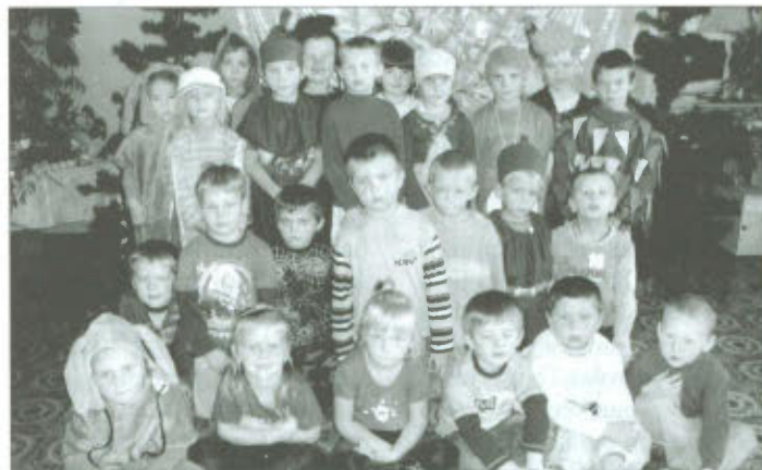
Dzieci z Przedszkola w Goniembicach

Zostaliśmy zaproszeni także na pasowanie naszych starszych kolegów na uczniów kl.I SP w Goniembicach. Dzieci przygotowały dla nich wesołe upominki. Miały też