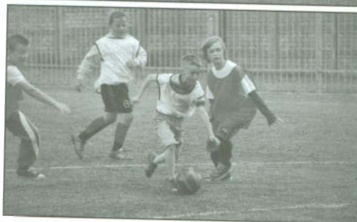
Mecz fanów finalistów Ligi Mistrzów 2013.