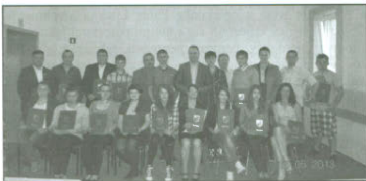
Stypendyści sportowi nagrodzeni za wysokie wyniki sportowe we współzawodnictwie międzynarodowym i krajowym.