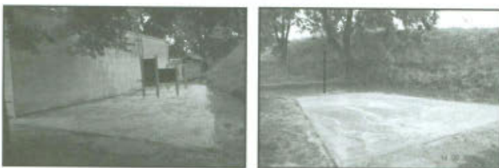
Prace przy świetlicy "Bursztyn" w Targowisku.

"Projekt współfinansowany przez Samorząd Województwa Wielkopolskiego w ramach Programu "Wielkopolska Odnowa Wsi"