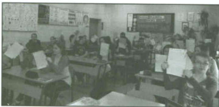
Listy do ziemi.