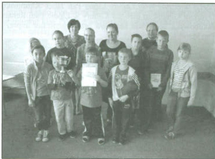
Warcabiści Finału Gminnego Szkół Podstawowych.