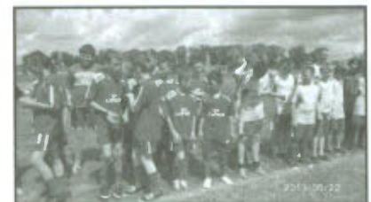
Wręczenie pucharów na VII Turnieju Piłki Nożnej Szkół Podstawowych o Puchar Wójta Gminy Lipno.

Rywalizowano ze sobą w systemie "każdy z każdym". Połowy trwały 10 minut, z 5 minutową przerwą. Ostatecznie po zaciętej rywalizacji osiągnięto następujące wyniki: