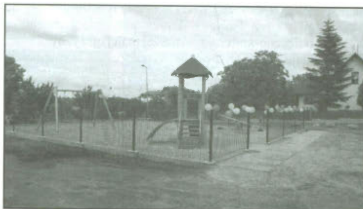
Plac zabaw w Wyciążkowie.

Projekt współfinansowany przez Unię Europejską w ramach Europejskiego Funduszu Społecznego