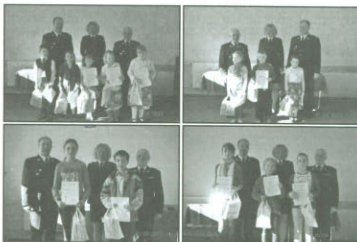
Nagrodzeni i wyróżnieni uczestnicy konkursu plastycznego.