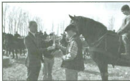
Wręczenie zwycięskiego pucharu.