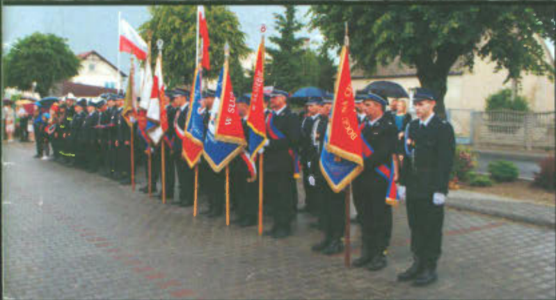
Jubileusz 90-lecia powstania Ochotniczej Straży Pożarnej w Lipnie str. 19