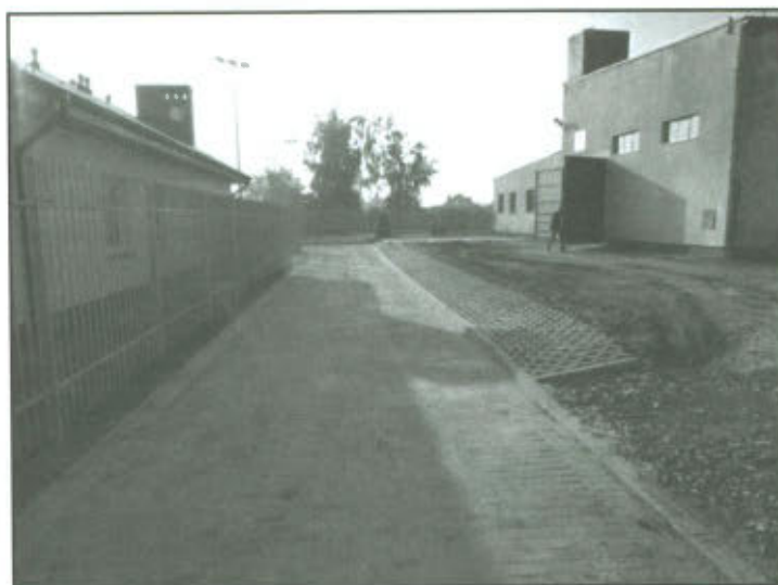
Zagospodarowanie terenu przy kompleksie boisk sportowych w Lipnie.

Projekt pn.: "Zagospodarowanie terenu przy kompleksie boisk sportowych w Lipnie" współfinansowany ze środków Unii Europejskiej w ramach Osi 4 LEADER Program Rozwoju Obszarów Wiejskich na lata 2007-2013