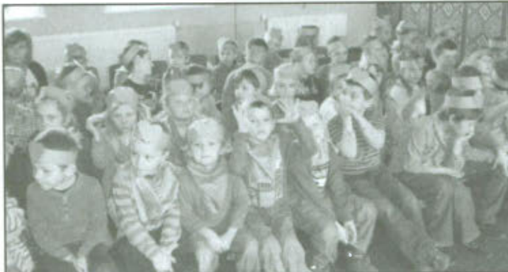
Dzień ziemi w przedszkolu w Lipnie.