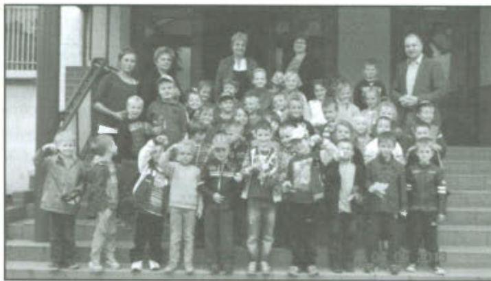
Wizyta zwycięzców Turnieju Piłki Nożnej w Urzędzie Gminy Lipno.

Chłopcy z naszej drużyny wygrali już dwa pierwsze mecze, co zadecydowało o tym, iż mogli grać dalej i walczyć o najwyższe podium - złote medale. Ostatni mecz z Rydzyną – decydujący – przyniósł wynik 4-1 dla naszych zawodników, stąd pewnikiem stało się, że wygramy! Trudno było uwierzyć, choć przedszkolna drużyna z Lipna była naprawdę dobrze przygotowana, świetnie prezentowała swoje umiejętności i wszystkie podejmowane mecze wygrywała. Warto było! Roześmiane twarze małych zawodników, błysk emocji i wrażeń w oczach, wyciągane do uścisku dłonie – wszystko to, świadczyło o ogromnym przeżyciu i zadowoleniu. To wielka satysfakcja dla przedszkolaków, dla ich rodziców, ale także dla nas – dla przedszkola, które tak wspaniale reprezentowali nasi wychowankowie. Im gratulujemy zwycięstwa i życzymy kolejnych sukcesów, a rodzicom zadowolenia ze swoich pociech. Trenerowi raz jeszcze mówimy dziękujemy.