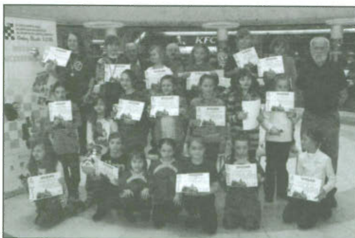
Uczestnicy I Ogólnopolskiego Turnieju Orliczek i Orlików w warcabach 100- Połowych