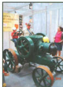
Pawilon Klubu „Traktor i Maszyna” i Gminy Lipno.