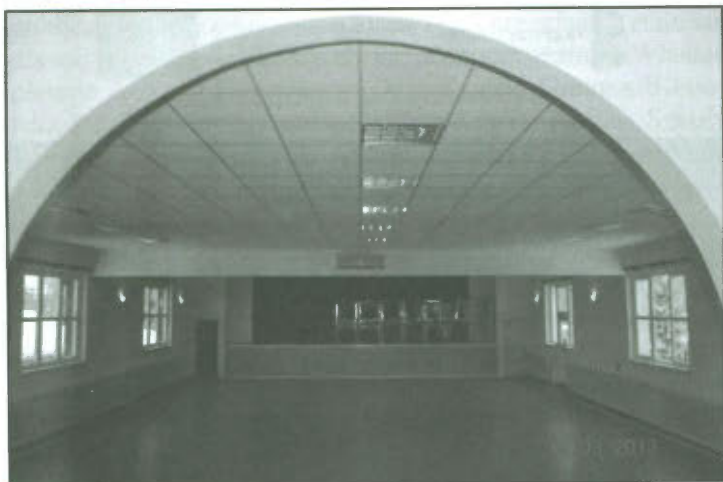
Dom Strażaka w Wilkowicach po modernizacji.