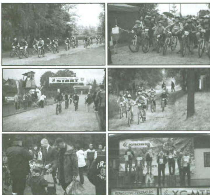
IV MTB Maraton o Puchar LUKS Orzeł Lipno.