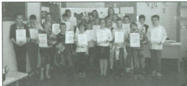
Uczestnicy Gminnego Konkursu Matematycznego "Mały Pitagoras".