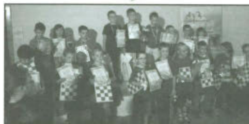
Drużynowe Mistrzostwa Polski Juniorów w warcabach klasycznych.