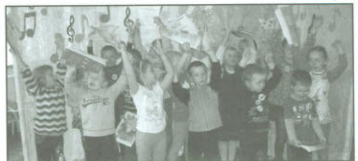
Konkurs piosenki "Lubimy Śpiewać".