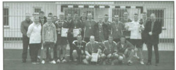
Turniej Piłki Ręcznej Mężczyzn o Puchar Wójta Gminy Lipno.