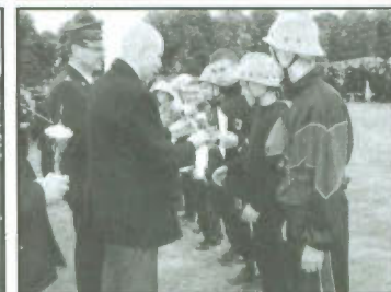
Gminne zawody sportowo-pożarnicze.