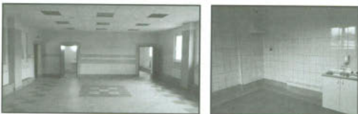
Świetlica wiejska w Żakowie po remoncie.