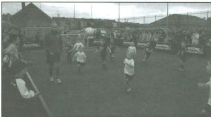
Turniej piłki nożnej w Rydzynie.

Chłopcy z naszej drużyny wygrali już dwa pierwsze mecze, co zadecydowało o tym, iż mogli grać dalej i walczyć o najwyższe podium - złote medale. Ostatni mecz z Rydzyną – decydujący – przyniósł wynik 4-1 dla naszych zawodników, stąd pewnikiem stało się, że wygramy! Trudno było uwierzyć, choć przedszkolna drużyna z Lipna była naprawdę dobrze przygotowana, świetnie prezentowała swoje umiejętności i wszystkie podejmowane mecze wygrywała. Warto było! Roześmiane twarze małych zawodników, błysk emocji i wrażeń w oczach, wyciągane do uścisku dłonie – wszystko to, świadczyło o ogromnym przeżyciu i zadowoleniu. To wielka satysfakcja dla przedszkolaków, dla ich rodziców, ale także dla nas – dla przedszkola, które tak wspaniale reprezentowali nasi wychowankowie. Im gratulujemy zwycięstwa i życzymy kolejnych sukcesów, a rodzicom zadowolenia ze swoich pociech. Trenerowi raz jeszcze mówimy dziękujemy.