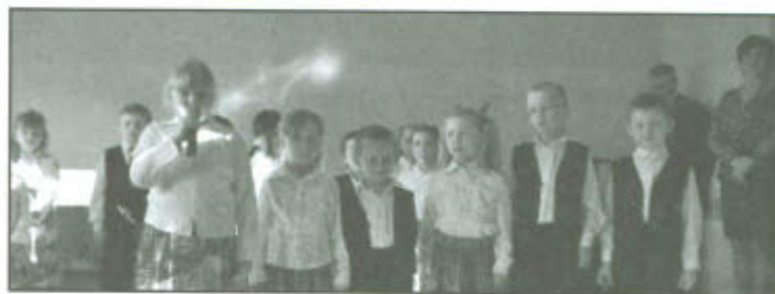
Dzieci z oddziału przedszkolnego w Goniembicach.