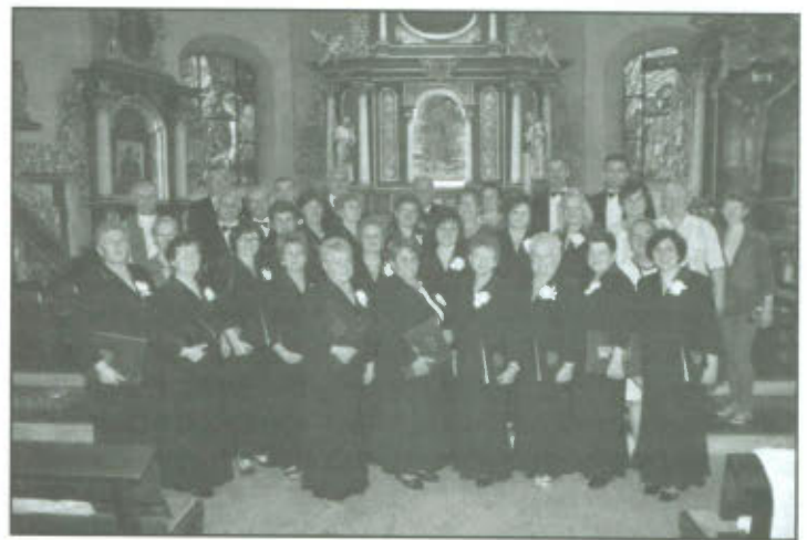
Chór Rapsodia w kościele parafialnym w Stężycy.

Na zaproszenie chóru ze Stężycy w dniach od 16 do 21 maja działający przy Gminnym Ośrodku Kultury w Lipnie chór RAPSODIA przebywał na Kaszubach. Chór uświetnił msze św. w kościele parafialnym w Stężycy oraz w Sanktuarium Matki Boskiej Sianowskiej Królowej Kaszub w Sianowie. Dużym zaskoczeniem dla chórzystów było to, że w odróżnieniu od dotychczasowych występów w kościołach, koncerty chóru odbywały się nie po mszy św. ale przed jej rozpoczęciem. Na 30 minut przed mszami kościoły były wypełnione wiernymi. Rapsodia zaśpiewała również w Muzeum Diecezjalnym w Pelplinie. Kilkundniowy pobyt na Kaszubach dostarczył wielu wspaniałych wrażeń, nowych znajomości i nowych utworów, które śpiewane są w języku Kaszubskim. Już 16 czerwca nowo poznane utwory chór zaprezentuje na Przeglądzie Muzyki i Piosenki Biesiadnej w Wijewie.