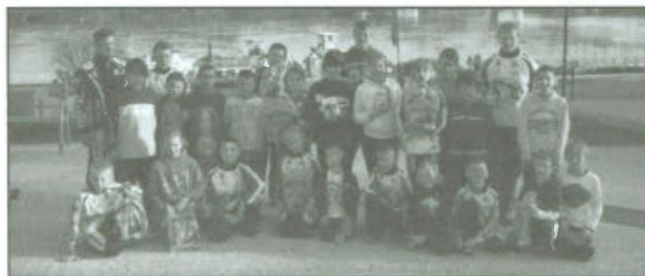
IV MTB Maraton o Puchar LUKS Orzeł Lipno.