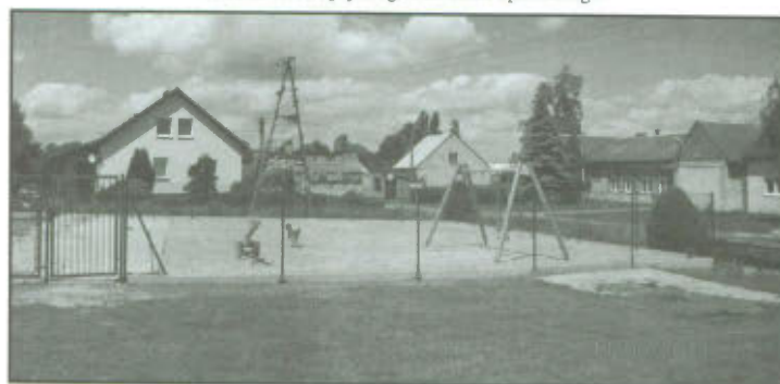
Plac zabaw w Górcie Duchownej.

Projekt współfinansowany przez Unię Europejską w ramach Europejskiego Funduszu Społecznego