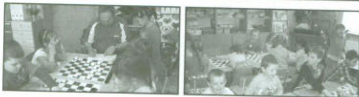
Wiosenny Turniej Warcabowy w Przedszkolu.