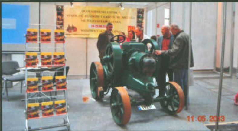
Gmina Lipno i Klub "Traktor i Maszyna" na Krajowej Wystawie Zwierząt Hodowlanych, MTP w Poznaniu. str. 20