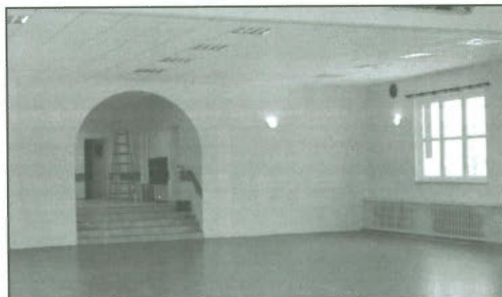
Dom Strażaka w Wilkowicach po modernizacji.