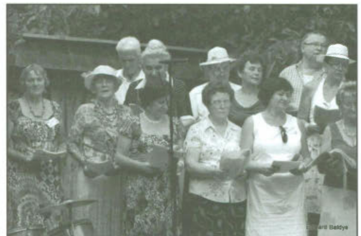
Leśne Lipcowe Biesiadowanie.