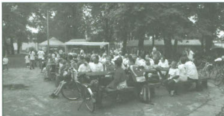
Święto Pieczonego Ziemniaka.