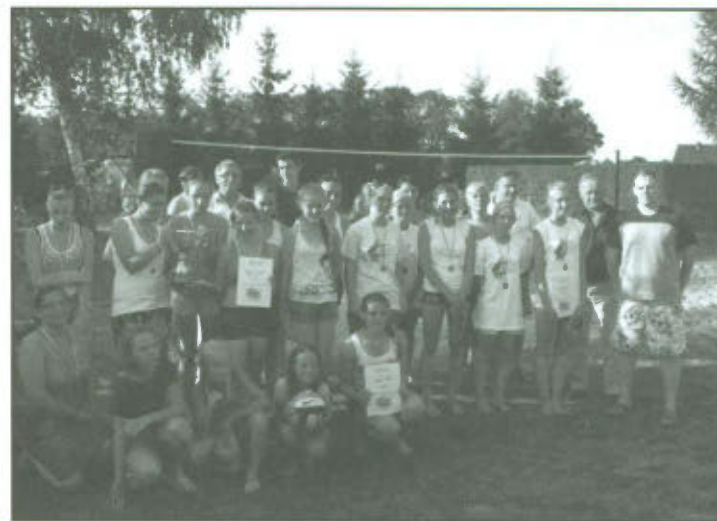
III Turniej Siatkówki Plażowej Kobiet o Puchar Wójta Gminy Lipno.