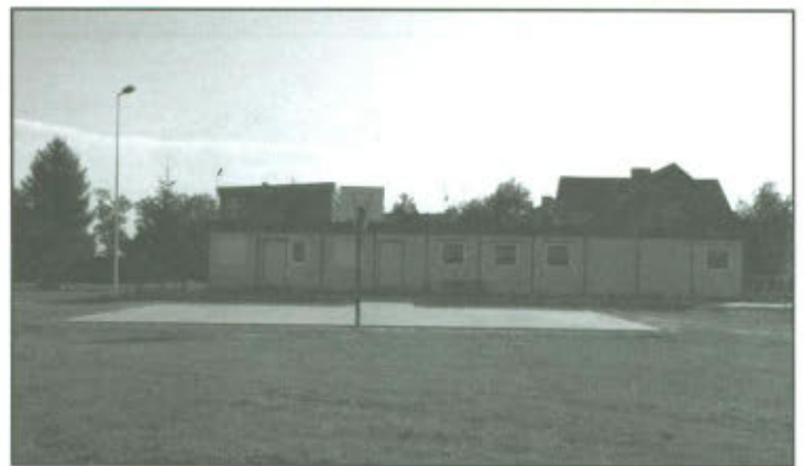
Kompleks sportowo-rekreacyjny w Goniembicach.

Projekt przyczyni się do integracji mieszkańców i zapewni dalszy rozwój ich aktywności sportowej. Na wybudowanym boisku do koszykówki, mieszkańcy będą mogli aktywnie spędzać wolny czas. Teren do gry w koszykówkę wzbogaci także lekcje wychowania fizycznego uczniów pobliskiej szkoły. Ponadto z uwagi na to, iż wszelkie imprezy sportowo - rekreacyjne oraz kulturalne odbywają się właśnie na terenie kompleksu, boisko służyć będzie także, jako parkiet do tańca oraz różnego rodzaju występów podczas organizowanych na terenie sołectwa Goniembice imprez i festynów.