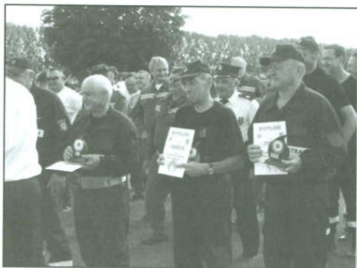
Zawody Oldbojów 2013.