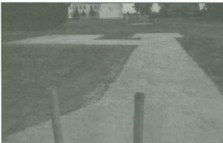
Wzbogacenie szlaku rowerowego przebiegającego przez sołectwo Wilkowice w obiekty infrastruktury turystycznej.