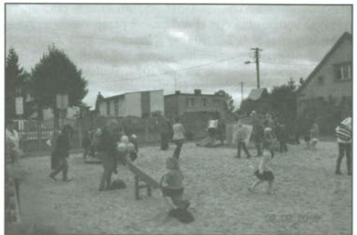
Oficjalne otwarcie placu zabaw w Lipnie.