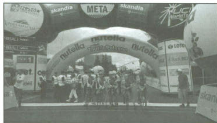
Nutella Mini Tour de Pologne.