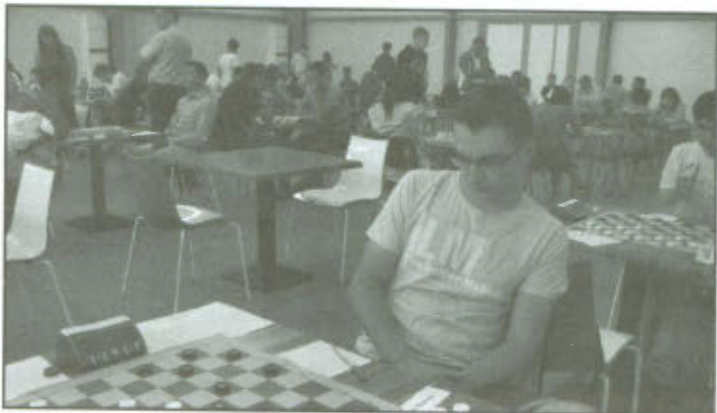
Mistrzostwa Świata do 23 lat w warcabach 64-polowych.