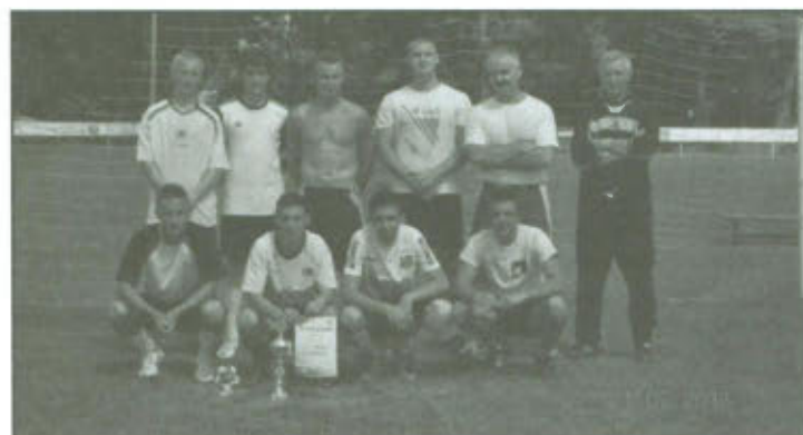
Turniej Piłki Nożnej o Puchar Wójta Gminy Lipno..