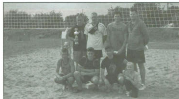
Plażowy Turniej Piłki Siatkowej im. Grzegorza Olejnika.

Organizatorzy serdecznie dziękują wszystkim za liczne przybycie, drużynom za udział w turnieju, Panu Zenonowi Wolnikowi za zaangażowanie oraz KGW za przygotowanie smacznego poczęstunku.