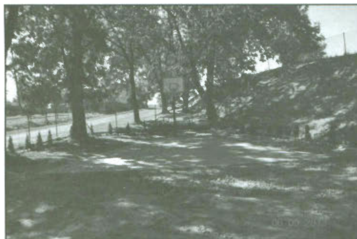
Zagospodarowanie terenu przy Świątlicy Wiejskiej "Bursztyń" w Targowisku.