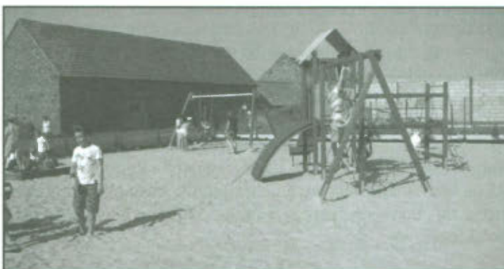
Otwarcie placu zabaw w Gronówku.