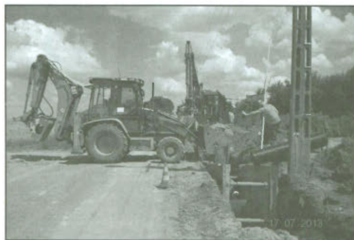
Budowa kanalizacji sanitarnej w Wilkowicach.