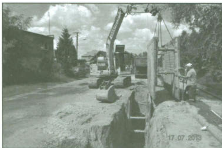
Budowa kanalizacji sanitarnej w Mórkowie etap II.