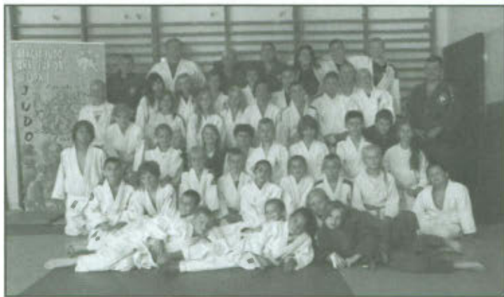
Zdjęcie grupowe uczestników zgrupowania sportowego Judo UKS „JUNIOR” Lipno.