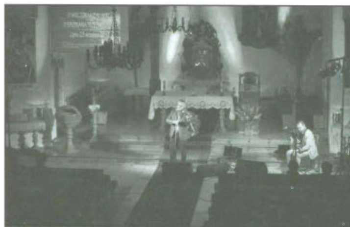
Wieczór Muzyki Serca, Spotkania Trzeźwościowe.