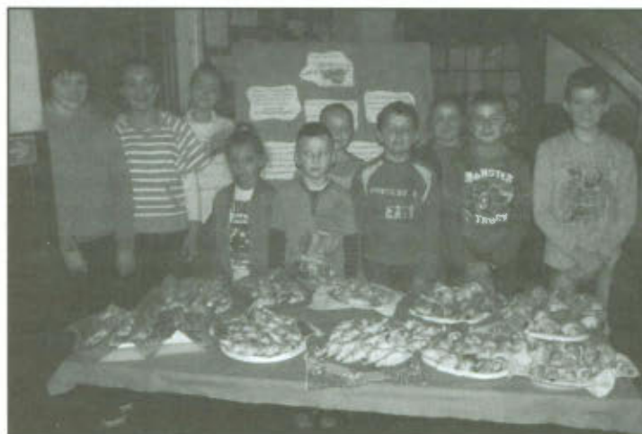
Uczniowie Szkoły Podstawowej w Górcie Duchownej.