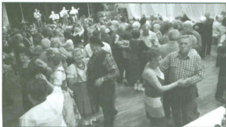
Fest Październikowe biesiadowanie.