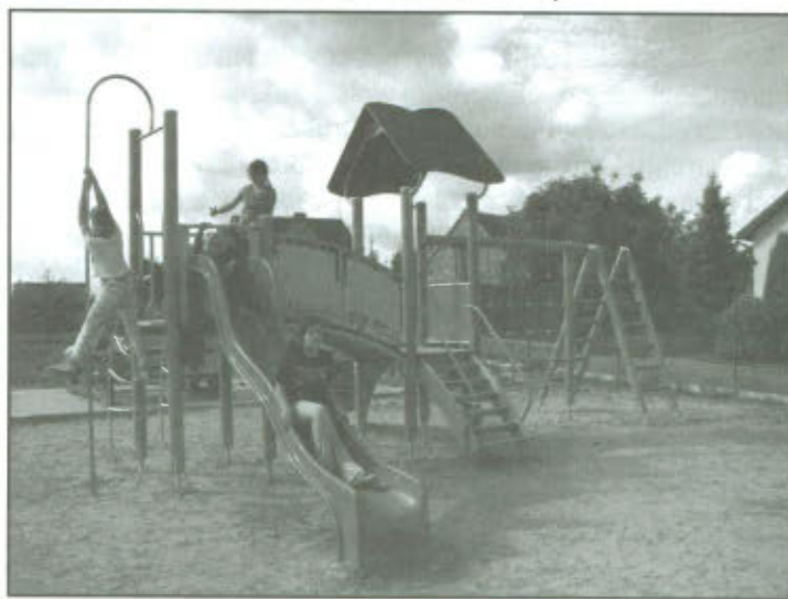
Zestaw zabawowy na placu zabaw w Górcie Duchownej.

Latem na placu zabaw zamontowano huśtawkę wagową, huśtawkę wahadłową, sprężynowiec oraz karuzelę. W ramach wyposażenia placu zabaw Gmina zakupiła zestaw zabawowy ze zjeżdżalnią, wejściem typu koci grzbiet, rurą strażacką, ścianką linową (szachownica) oraz drabinką krzyżową za kwotę 13500,00 zł brutto. Elementy wyposażenia placu zabaw dostarczyła i zamontowała firma Foresto - Waldemar Moroz ze Środy Wielkopolskiej.