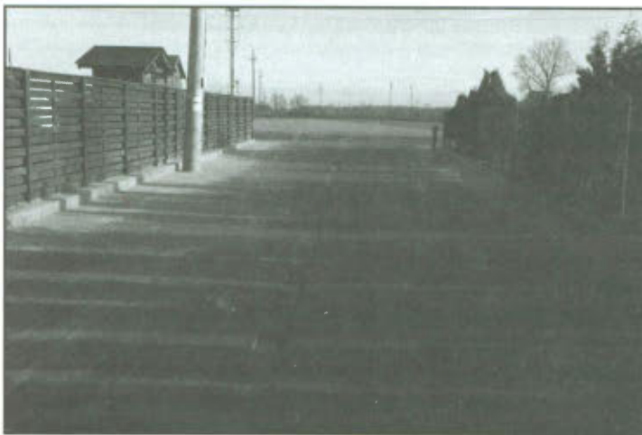
Utwardzenie łącznika między ul. Spółdzielczą i ul. Nową w Lipnie.

Gmina Lipno dostarczyła na plac budowy 995,28 m 2 kostki brukowej betonowej i 300 m krawężnika drogowego betonowego. Pozostałą ilość materiałów w ramach inwestycji zakupił wykonawca. Odbiór prac nastąpił 14 listopada 2013 r. Wartość inwestycji na podstawie kosztorysu powykonawczego wynosiła blisko 204 tys. zł brutto.