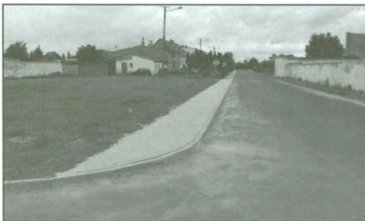
Odcinek wybudowanego chodnika od drogi z Żakowa w kierunku Ratowic.