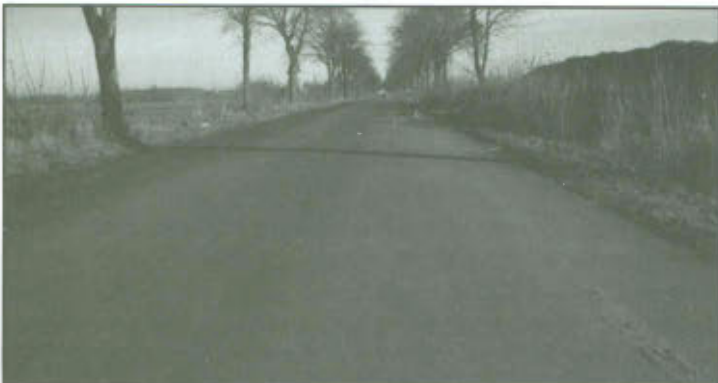
Odcinek zmodernizowanej drogi powiatowej w Górcie Duchownej.

Z końcem listopada zakończyły się prace związane z modernizacją odcinka drogi powiatowej pomiędzy skrzyżowaniem przy Sanktuarium Matki Bożej Pocieszenia, a dworcem kolejowym w Górcie Duchownej. Wykonawcą prac było Leszczyńskie Przedsiębiorstwo Robót Drogowo-Mostowych Sp. z o.o. z Leszna. Koszt inwestycji opiewał na kwotę 197070,60 zł brutto, która została pokryta w całości ze środków Starostwa Powiatowego w Lesznie.