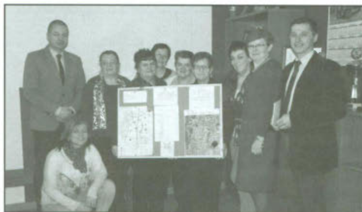
Spotkanie z uczestnikami projektu „Aktywni Wielkopolskie - Potencjał i Atut”