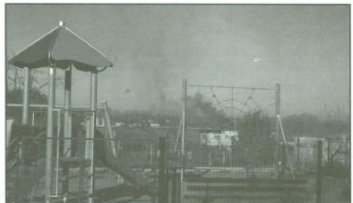
Plac zabaw w Wyciążkowie.