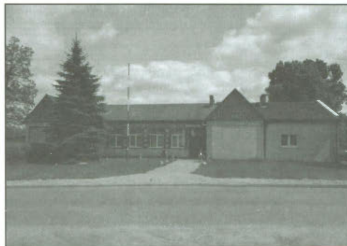
Świetlica Wiejska w Górcie Duchownej - stan aktualny.

W czerwcu 2013 r. Gmina Lipno złożyła wniosek o dofinansowanie ze środków EFRROW w ramach Programów Rozwoju Obszarów Wiejskich na lata 2007-2013 na realizację zadania pn. „Wymiana pokrycia dachowego oraz docieplenie ścian świetlicy wiejskiej w Górcie Duchownej”. Projekt został wybrany przez Radę WLGD „Kraina Lasów i Jezior” do finansowania i został skierowany do weryfikacji w Urzędzie Marszałkowskim w Poznaniu. Realizacja zadania planowana jest na rok 2014.