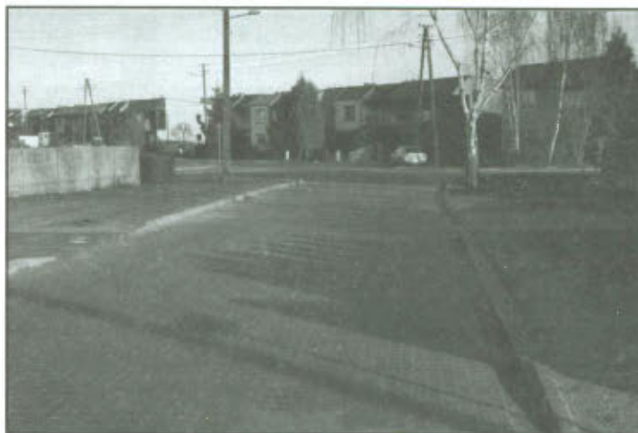
Utwardzenie ul. Nowej w Lipnie.