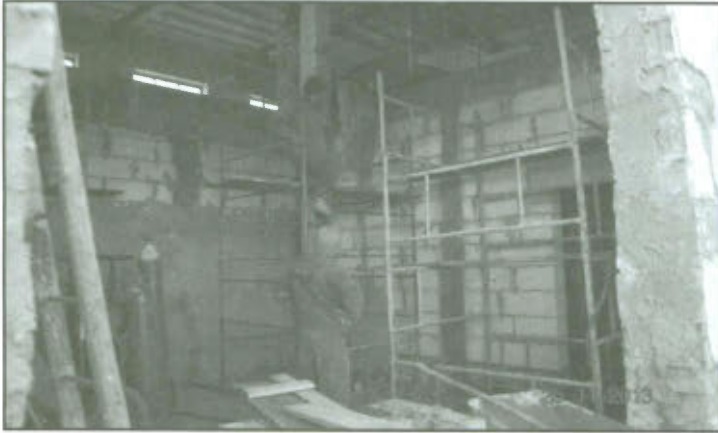
Prace w pomieszczeniu gospodarczym przy Gimnazjum w Lipnie.