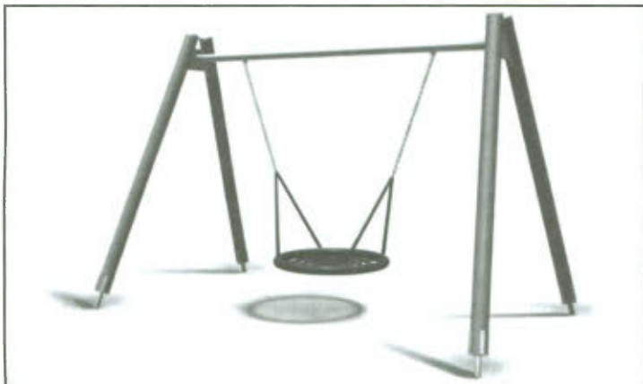
Rys. 1 Huśtawka wahadłowa „bocianie gniazdo”.