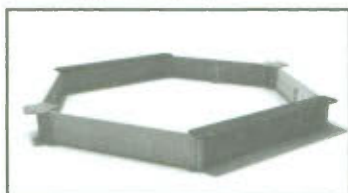
♦ Rys. 4 Piaskownica sześciokątna.