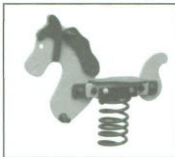
↑ Rys. 3 Bujak na sprężynie.