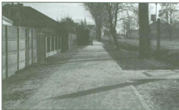
Ścieżka pieszo - rowerowa przy drodze krajowej nr 5.

Realizacja kolejnego etapu inwestycji planowana jest na rok 2014.