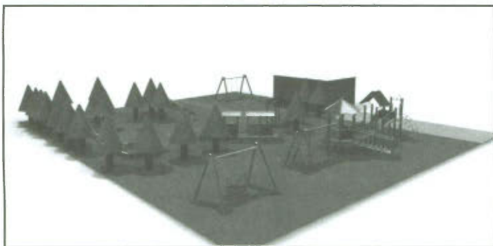
Przykładowa wizualizacja placu zabaw dla dzieci w Wilkowicach.

Poniżej przedstawiamy przykładowe rysunki niektórych zamówionych urządzeń: