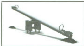
Rys. 2 Huśtawka wagowa.