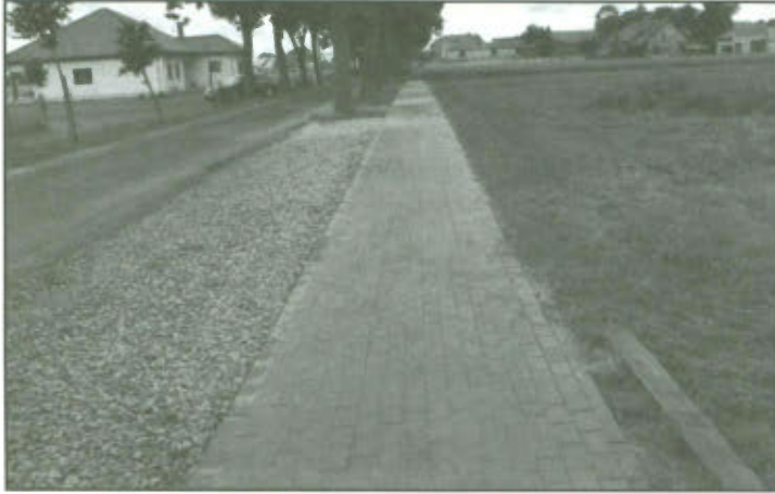
Chodnik w Klonówcu.

W roku 2012 rozpoczęto budowę chodnika wzdłuż drogi gminnej, która biegnie od bloków mieszkalnych w kierunku drogi krajowej nr 5. Wybudowano wówczas około 50 m chodnika. W roku bieżącym wybudowano dalszy odcinek chodnika około 76 m. Zakres prac obejmował: wykonanie koryta pod układaną kostkę, obrzeża, krawężniki betonowe, ułożenie obrzeża i krawężników drogowych oraz kostki brukowej.