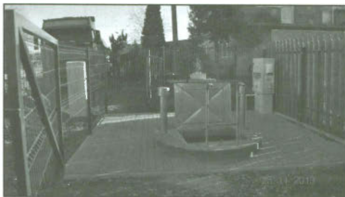
Kanalizacja sanitarna w Mórkowie etap II.