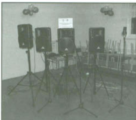
Nagłośnienie do Domu Strażaka w Wilkowicach.

Elementy zakupionego nagłośnienia: - 4 statywy kolumnowe, - mikser, - 4 kolumny aktywne, - zestaw bezprzewodowy, - mikrofon pojemnościowy, - mikrofon dynamiczny, - 5 kabli mikrofonowych XLR/XLR, - 2 kabli mikrofonowe XLRm/Jack, - 3 statywy mikrofonowe.