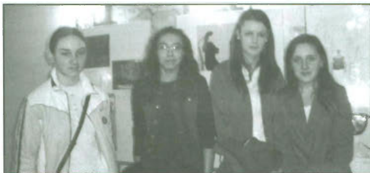
Uczennice Gimnazjum im. gen. Dezyderego Chłapowskiego w Lipnie.