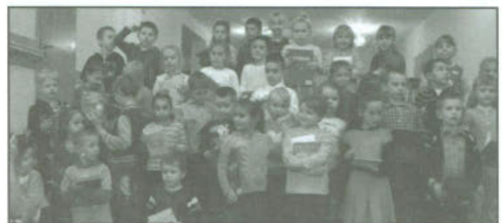
Laureaci konkursu "Para buch! Farby i kredki w ruch!!!"