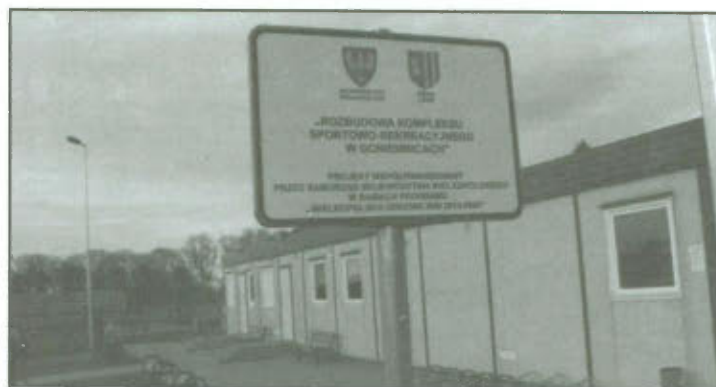
Otwarcie kompleksu rekreacyjno - sportowo w Goniembicach.