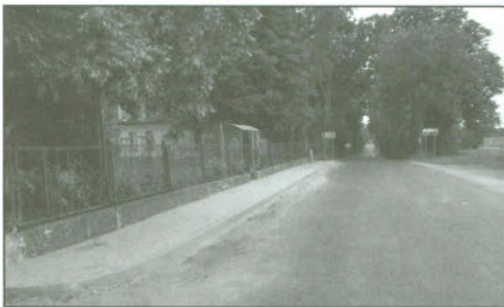
Odcinek wybudowanego chodnika na wjeździe do Koronowa od strony Goniembic.

Wzorem poprzednich lat, tak i w tym roku, w ramach funduszu sołeckiego w miejscowości Koronowo wybudowano nowe chodniki. Jeden odcinek około 40 m powstał na wjeździe do miejscowości od strony Goniembic, natomiast drugi odcinek około 60m od skrzyżowania z drogą z Żakowa w kierunku Ratowic.