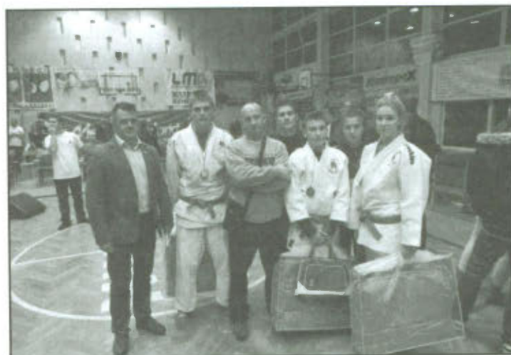
Zawodnicy Sekcji Judo UKS „Junior” z raperem Ryszardem Andrzejewskim - PEJA.

negatywnych zachowań. W tym miejscu chcemy podziękować za zaproszenie na Drużynową Galę Judo w Koninie i pogratulować organizacji turnieju, a naszym zawodnikom podziękować za godne reprezentowanie naszego klubu.