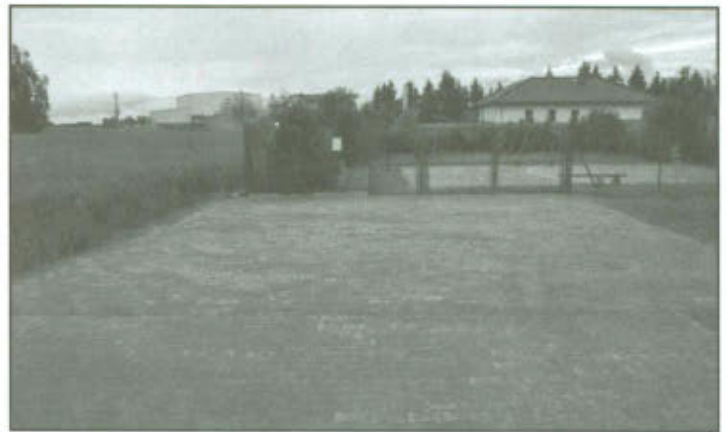
Utwardzenie terenu przy Świetlicy Wiejskiej w Mórkowie - 2013 r.

Ponadto w ramach funduszy sołeckich w roku 2013 wykonano także: