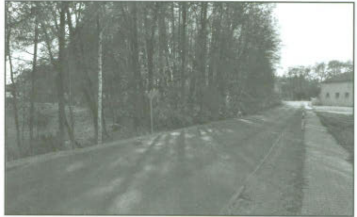
Odcinek drogi powiatowej w Żakowie.

W październiku na zlecenie Starostwa Powiatowego w Lesznie, Przedsiębiorstwo Drogowe DROGBUD Sp. z o.o. z Gostynia dokonało naprawy odcinka drogi powiatowej przy skrzyżowaniu dróg Żakowo - Górka Duchowna - Koronowo. Inwestycja obejmowała wzmocnienie podbudowy drogi, zabezpieczenie krawędzi drogi krawężnikami oraz wykonanie nowej nawierzchni asfaltowej. Gmina udzieliła dotacji na remont drogi w kwocie 50000,00 zł brutto.