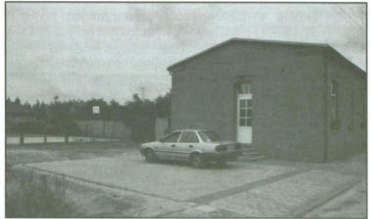
Utwardzenie terenu przy Świetlicy Wiejskiej w Mórkowie - 2012 r.

W roku 2012 rozpoczęto inwestycję polegającą na utwardzaniu terenu przed świetlicą wiejską w Mórkowie. Wówczas ułożono kostkę brukową na odcinku od ulicy do końca budynku świetlicy wiejskiej. Natomiast w tym roku wykonano dalszy ciąg tj. od końca budynku świetlicy wiejskiej do ogrodzenia placu zabaw.