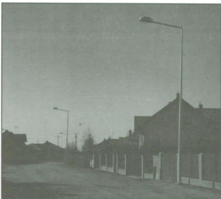
Nowe oświetlenie uliczne w Wilkowicach.

W obrębie ul. Szkolnej, Akacyjnej i Klonowej w Wilkowicach postawiono 7 lamp oświetlenia ulicznego. Wykonawcą gminnej inwestycji był Zakład Elektrotechniczny J.J.R. Chomscy Sp.J. z Koszanowa, który został wyłoniony w drodze zapytania ofertowego. Koszt budowy oświetlenia ulicznego wyniósł 29451,52 zł brutto.