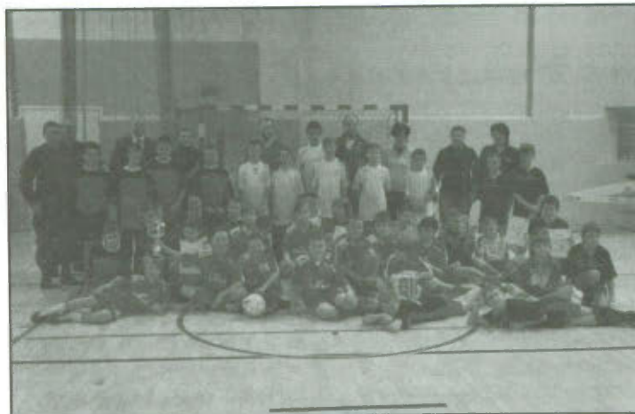
Mikołajkowy Turniej Piłki Nożnej Szkół Podstawowych Gminy Lipno.