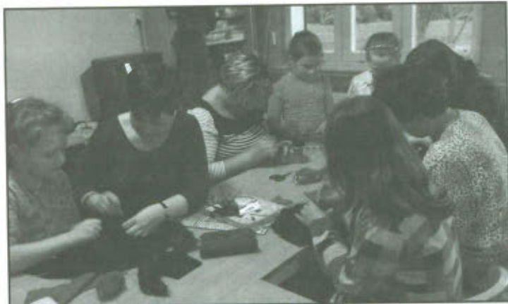
Warsztaty z filcowania na sucho.

Jednym z projektów Szkoły Podstawowej w Lipnie na rok szkolny 2013/14 są zapowiedziane wcześniej warsztaty dla rodziców i ich dzieci, których celem miało być dzielenie się wiedzą i umiejętnościami. W założeniu zajęcia miały odbywać się raz lub dwa razy w miesiącu... w zależności od zainteresowania. Zaczęliśmy warsztatami z filcowania na sucho, następnie miało być decupage... miało być, jednak i dzieci i mamy tak zasmakowały w zabawach z wełną czesankową i igłą do filcowania, że zmiana tematu zajęć została odłożona... aż do znudzenia się filcowaniem. Jednak na to się nie zanoszą. Na zajęcia przychodzą mamy z córkami i synami, chcący spędzić czas przy zajęciach ręcznych, które żartobliwie nazwaliśmy „darcie pierza”. Kiedy byłam jeszcze młodą dziewczyną, moja mama, która pochodziła ze wsi, organizowała takie wieczory w naszym domu. I tam naprawdę darło się pierze. Mogę się pochwalić, że pierze na poduszki i kołdry mojej wyprawy darłam własnoręcznie. Czułe wspominam te pełne śmiechu i rozmów kobiece wieczory i to pewnie stąd wzięła się chęć powrotu do przeszłości. Teraz w klimacie swobodnych rozmów rodziców i dzieci, przy kawce i herbatce powstają prawdziwe dzieła sztuki. Wszyscy zasmakowaliśmy w „malowaniu” wełną i igłą, tym mocniej, że ozdabiane „malowidłami” swetry,