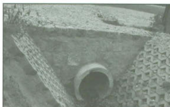
↑ W trakcie remontu przepustu w Goniembicach.