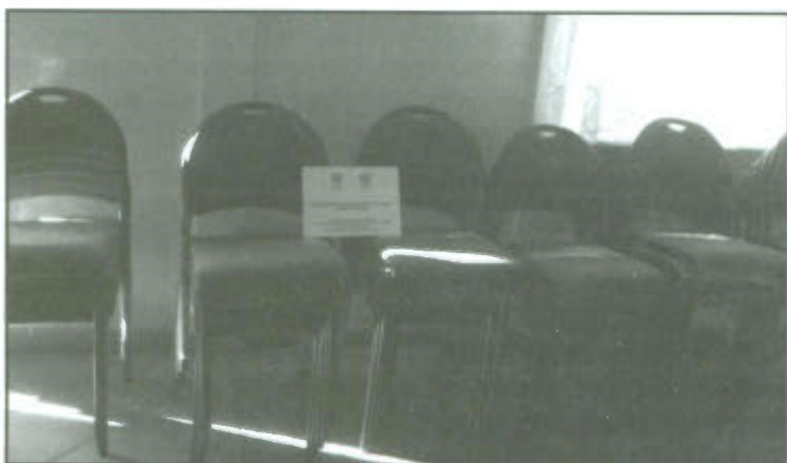
Krzeseła do świetlicy wiejskiej w Ratowicach.

W ramach projektów dokonano zakupu nagłośnienia do Domu Strażaka w Wilkowicach za kwotę 6497,00 zł (projekt pn. „Zakup nagłośnienia do Domu Strażaka będącego świetlicą wiejską sołectwa Wilkowice”), krzeseł do świetlicy wiejskiej w Ratowicach w kwocie 2889,27 zł (projekt pn. „Zakup krzeseł do świetlicy wiejskiej w Ratowicach”) oraz wyposażenia w postaci lodówki i kuchenki gazowo - elektrycznej do świetlicy wiejskiej w Targowisku w kwocie 2647,00 zł (projekt pn. „Zakup wyposażenia do świetlicy wiejskiej w Targowisku”) i dwóch kuchenek gazowo - elektrycznych do świetlicy wiejskiej w Żakowie za kwotę 2353,99 zł (projekt pn. „Żakowskie tradycyjne gotowanie”). Dofinansowanie z budżetu Województwa Wielkopolskiego wyniosło 50%. W przypadku zakupu nagłośnienia do Domu Strażaka w Wilkowicach znaczną część kosztów w wysokości 4169,00 zł pokryło sołectwo Wilkowice.