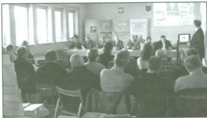
Gminne Forum Rolnicze.

Forum Rolnicze było świetną okazją do zdobycia wiedzy i wymiany doświadczeń dla rolników z naszej Gminy.