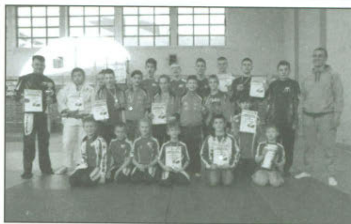
Uczestnicy XI Międzynarodowego Turnieju Judo Dzieci i Juniorów Młodszych w Kaczorach.

Ponadto warto zaznaczyć że Sekcja Judo UKS „JUNIOR” w Lipnie w klasyfikacji drużynowej wywalczyła