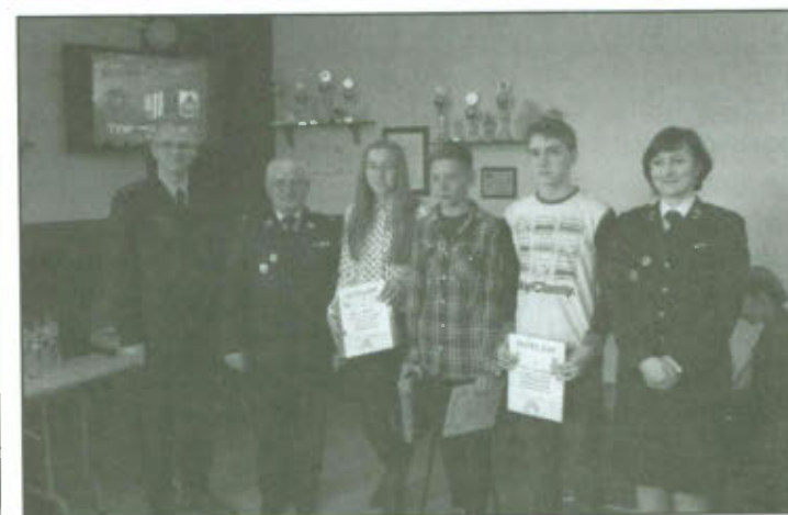
Zwycięzcy eliminacji Gminnego Ogólnopolskiego Turnieju Wiedzy Pożarniczej „Młodzież zapobiega pożarom”.