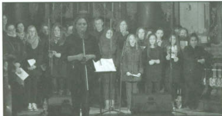
Warsztaty Gospel w klasztorze Franciszkanów w Osiecznej.

GMINNY OŚRODEK KULTURY W LIPNIE ZAPRASZA NA