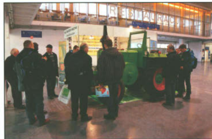
Punkt informacyjny Klubu "Traktor i Maszyna" i Gminy Lipno na Targach Mechanizacji Rolnictwa Polagra PREMIERY.