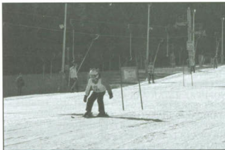
Trasa przejazdu podczas Mistrzostw Powiatu Leszczyńskiego w Narciarstwie Alpejskim i Snowboardzie.