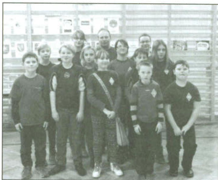
Zawodnicy UKS "Roszada" na Młodzieżowych Mistrzostwach Polski w Horyńcu-Zdrój.