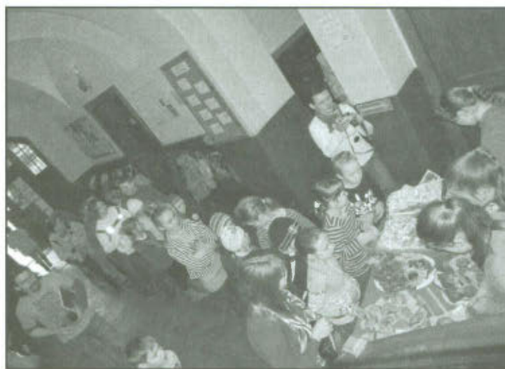
Tłusty Czwartek w Szkole Podstawowej w Górcie Duchownej.