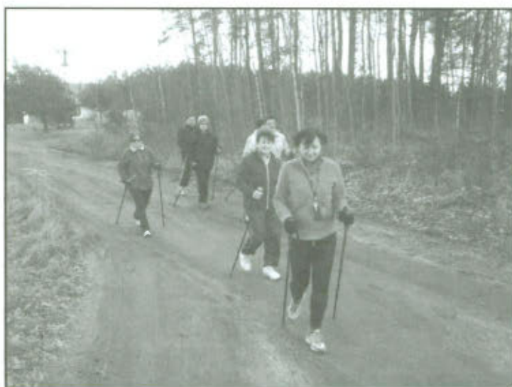
Uczestnicy marszu Nordic Walking.