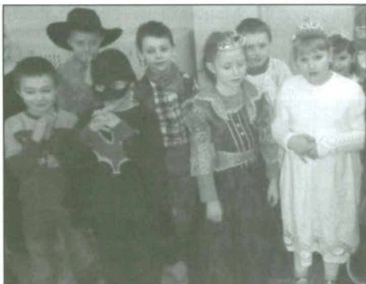
Bal karnawałowy w Szkole Podstawowej w Goniembicach.