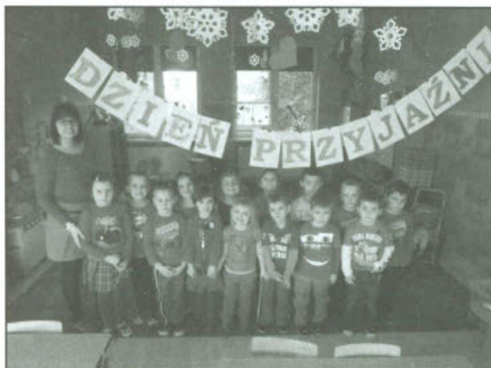
Dzień przyjaźni i tolerancji.

Dzieci z Przedszkola w Lipnie obchodziły 18 lutego 2014 r. „Dzień Przyjaźni i Tolerancji”. W czasach, kiedy coraz trudniej o prawdziwą przyjaźń wychowawcy próbowali pokazać przedszkolakom jak wielką wartością jest posiadanie bliskich, znajomych, którzy są na dobre i na złe. Pierwsze znajomości, koleżeństwa których przyjaźnie, o których pamiętamy całe życie „rodzą się” właśnie w przedszkolu, szkole, czy na podwórku. Dzieci w tym wyjątkowym dniu uczestniczyły w zorganizowanych grach, zabawach, konkursach, które miały na celu przybliżenie pojęcia tolerancja. Jak należy odnosić się do ludzi, którzy są chorzy, biedniejsi, którzy są z innych rejonów świata, mają inny kolor skóry - jak choćby znany Murzynek Bambo. Przedszkolaki dowiedziały się, że świat i żyjący na nim ludzie są członkami różnych społeczeństw, kultur, inaczej wyglądają, mówią innymi językami. Dzieci radośnie opowiadały o swoich najbliższych, o zwierzętach, które są ich prawdziwymi przyjaciółmi, o tym, że dobrze mieć małego pluszowego Misia, który jest ich przyjacielem... Przedszkolaki odpowiednio przygotowały się na ten dzień. Każdy przyszedł do przedszkola ubrany w coś czerwonego. Od czerwonych ubranek dzieci i pań zrobiło się jakoś tak ciepłutko i radośnie. Serduszką zdobiące salę nastrajały wszystkich bardzo pozytywną energią. Dzień przyjaźni i tolerancji to nie tylko okazja do wyrażania uczuć wyższych i głębszych, ale także możliwość okazania równie ważnych i cennych doznań takich jak: wyrozumiałość,