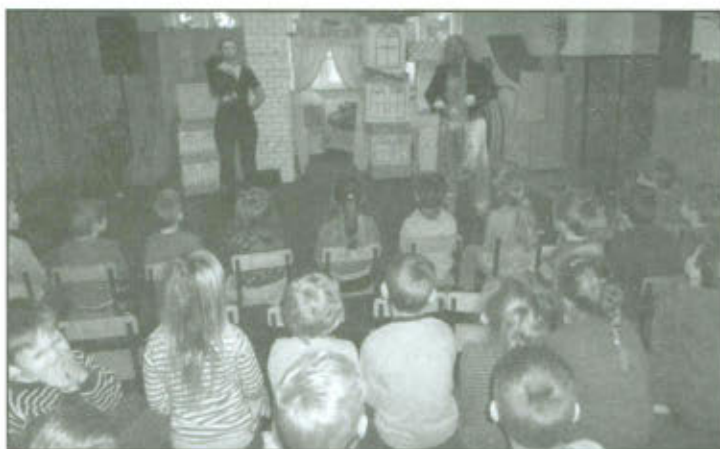
„Akademia Pana Kleksa”.