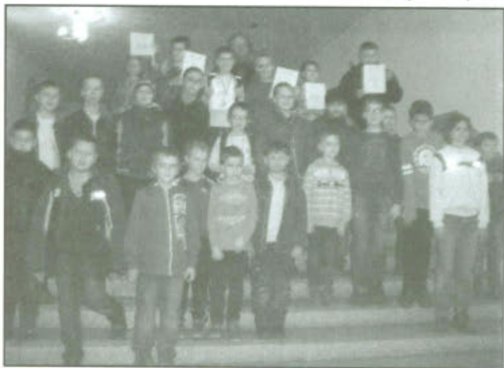
Eliminacje powiatowe Igrzysk Młodzieży Szkolnej.