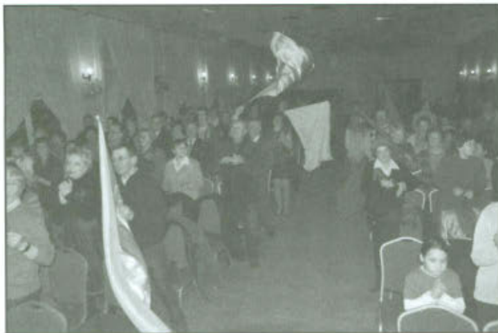
Koncert muzyki gospel.