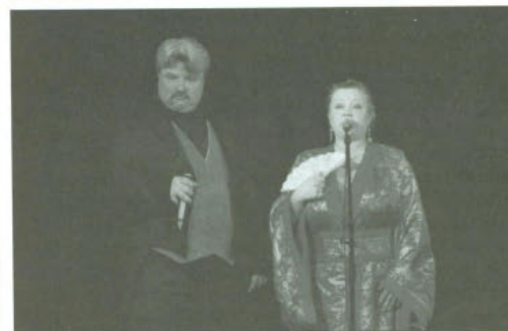
Koncert Operetkowy z Nutką Humoru.