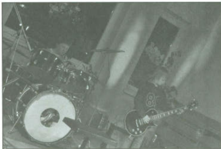
Koncert młodych instrumentalistów.