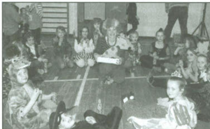
Bal Karnawałowy w Szkole Podstawowej w Lipnie.