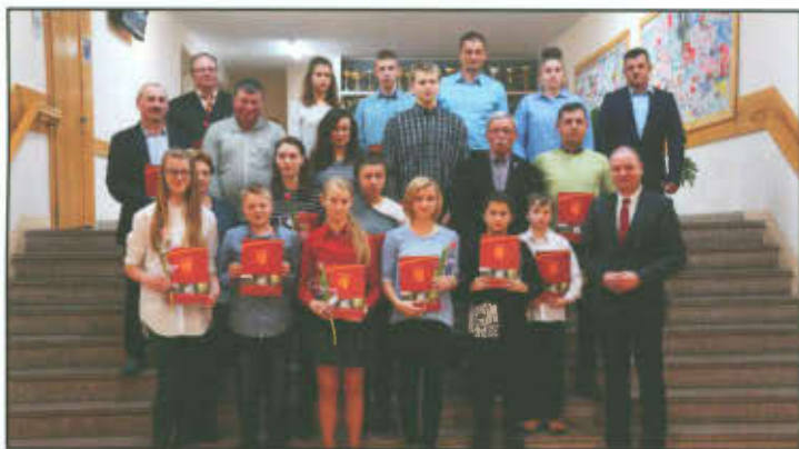
Zdjęcie grupowe stypendystów.

10 marca 2016 r. odbyło się uroczyste wręczenie stypendiów sportowych zawodnikom zamieszkałym na terenie Gminy Lipno, którzy w 2015 r. osiągnęli wysokie wyniki sportowe we współzawodnictwie międzynarodowym lub krajowym.