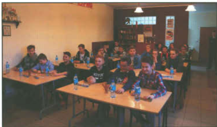
Uczestnicy Turnieju Wiedzy Pożarniczej.