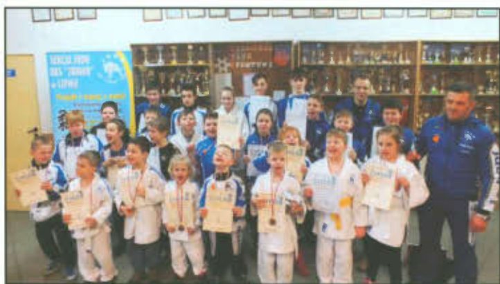
Zdjęcie grupowe UKS „Junior” Lipno.

W dniu 20 lutego 2016 r. zawodnicy Sekcji Judo UKS „Junior” w Lipnie, startowali w XIII Międzynarodowym Turnieju Judo Dzieci, Młodzików, Juniorów Młodszych w Kaczorach/Piła. Zawody zgromadziły około 350 uczestników z 27 klubów z całej Polski od Szczecina po Wrocław oraz ekipy z Niemiec i Rosji.