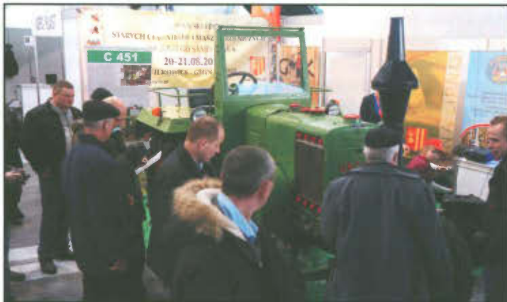
Stoisko promujące Festiwal na Międzynarodowych Targach Poznańskich.

Klub "Traktor i Maszyna", Gmina Lipno i Gminny Ośrodek Kultury w Lipnie promowały Ogólnopolski Festiwal Starych Ciągników i Maszyn Rolniczych w Wilkowicach podczas Międzynarodowych Targów Rolniczych "Polagra Premiery" na Międzynarodowych Targach Poznańskich w dniach od 21 do 24 stycznia 2016 r.