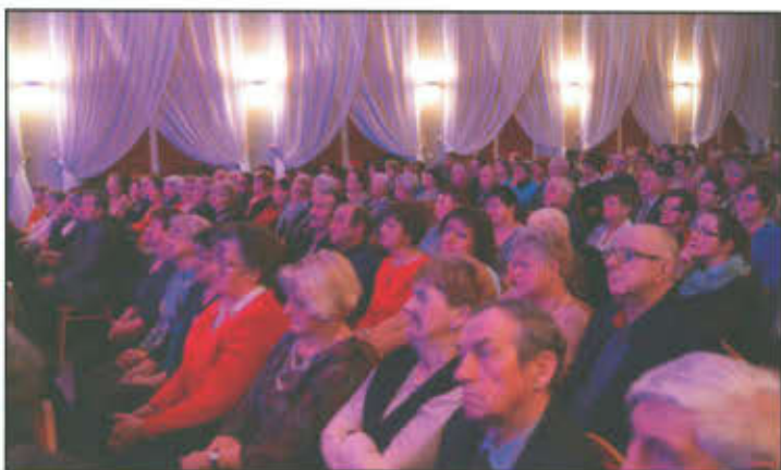
Widownia operetkowego koncertu z okazji Dnia Kobiet.