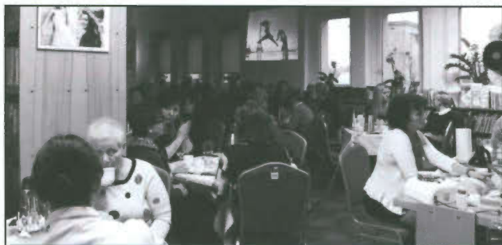
Dzień Kobiet w Bibliotece.