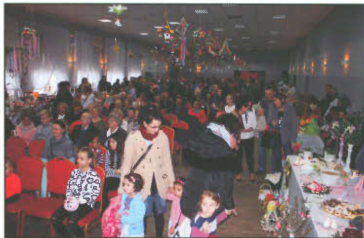
Wielkanoc w Tradycji w Gminnym Ośrodku Kultury w Lipnie.