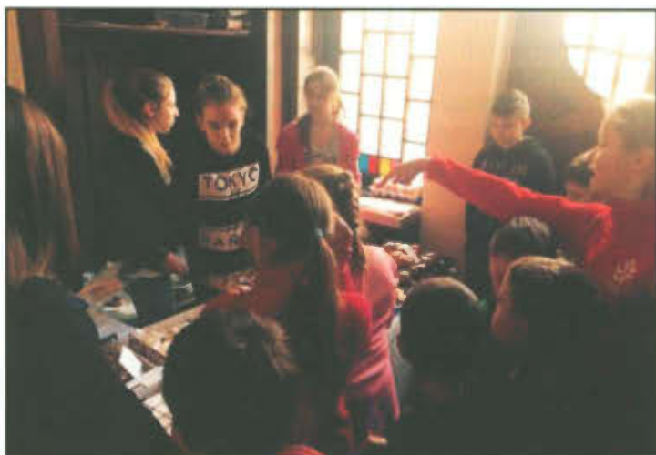
Tłusty czwartek w Szkole Podstawowej w Górcie Duchownej.