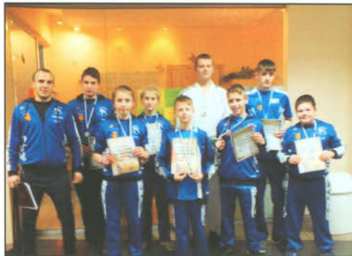
Zawodnicy UKS „Junior” Lipno na Mistrzostwach Wielkopolski w Poznaniu.