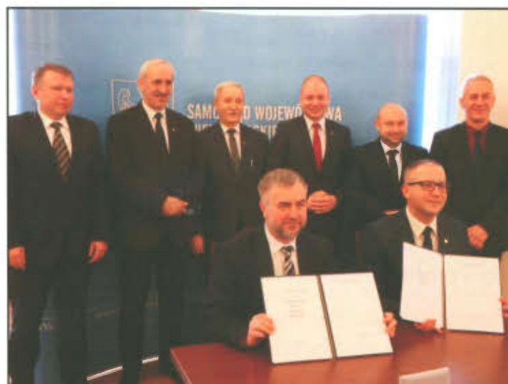
Podpisanie mandatu terytorialnego dla Leszczyńskiego OSI.

Mechanizmem objęte zostały: Miasto Leszno (lider OSI), Powiat Leszczyński oraz gminy Osieczna, Lipno, Święciechowa i Rydzyna. Przewidziana na mocy Uchwały Zarządu Województwa Wielkopolskiego pula środków na realizację Mandatu Terytorialnego dla Leszczyńskiego OSI wynosi prawie 19 mln euro, w tym z Europejskiego Funduszu Rozwoju Regionalnego to kwota 16 762 486 euro, a z Europejskiego Funduszu Społecznego to 2 135 469 euro.