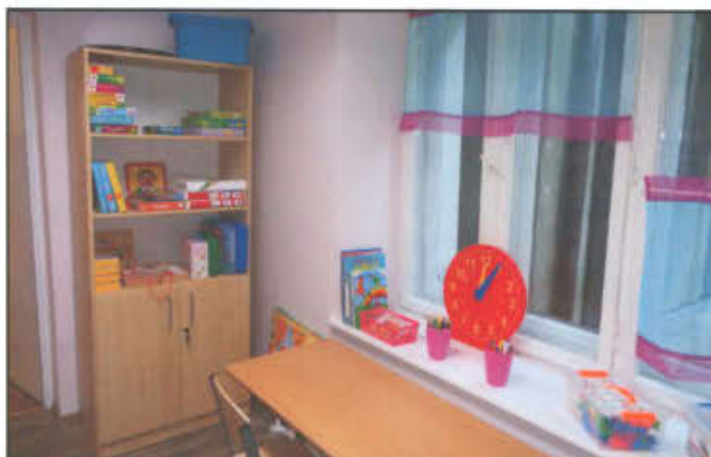
Gabinet zajęć specjalistycznych w Szkole Podstawowej w Goniembicach.