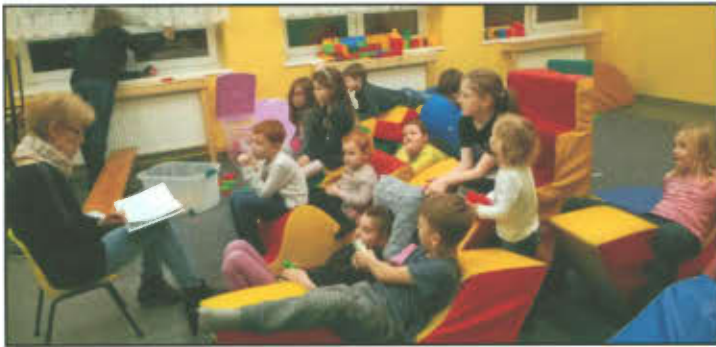
Wieczorek czytelniczy w Szkole Podstawowej w Lipnie.

Już kolejny rok w Szkole Podstawowej w Lipnie wspólnie z rodzicami organizujemy wieczorki czytelnicze. Nie każdy maluch może już czytać sam, więc rodzice i nauczyciele czytają im wybrane przez siebie bajki. Na wieczorku panuje radosna atmosfera. Oczywiście, kiedy czytana jest bajka, wszyscy są zasłuchani. Nawet najmłodszy. Jednak potem odpowiadają na pytania związane z bajką. Na wyścigi. Nagrody są pyszne i słodkie! W przerwach dzieci bawią się klockami albo same próbują opowiadać różne historie. Z każdym wieczorkiem czytelniczym przybywa nam słuchaczy. Mamy nadzieję, że tak jak słuchanie bajek, tak ich czytanie, stanie się dla naszych najmłodszych przyjemnością.