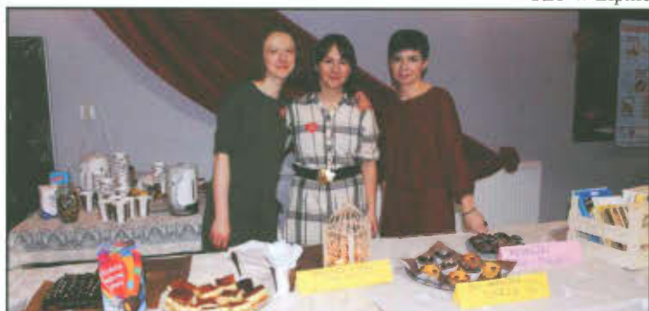
Biblioteka podczas 24 Finału WOŚP.