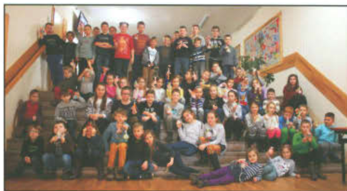
Zdjęcie grupowe uczestników ferii.