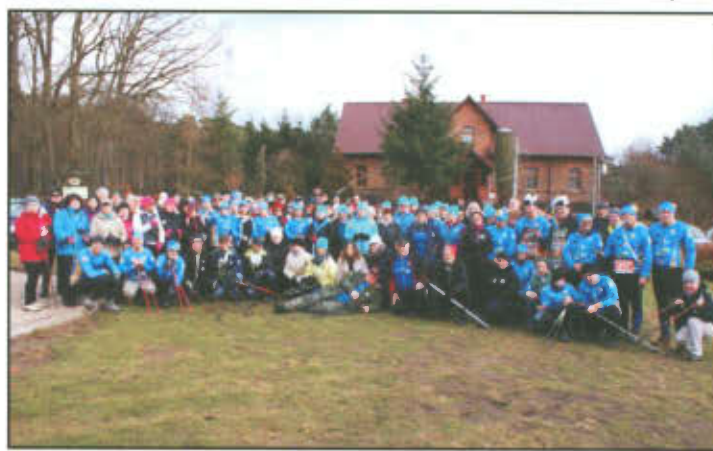
Mistrzostwa Powiatu Leszczyńskiego i miasta Leszna w warcabach.