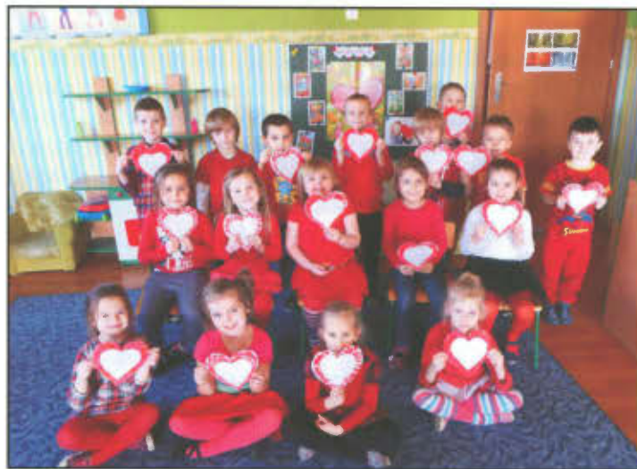
Kolorowe Dni w Przedszkolu w Lipnie.