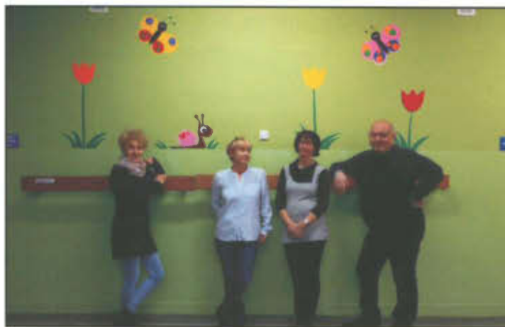
Dekorowanie ścian w Szkole Podstawowej w Lipnie.