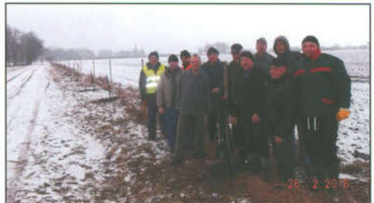
Zdjęcie grupowe podczas akcji sadzenia lip w Wilkowicach.