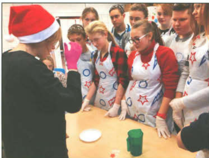
Gimnazjaliści w Laboratorium Wyobraźni w Poznaniu.