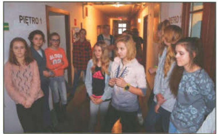
Zwiedzanie Teatru Wielkiego w Poznaniu.