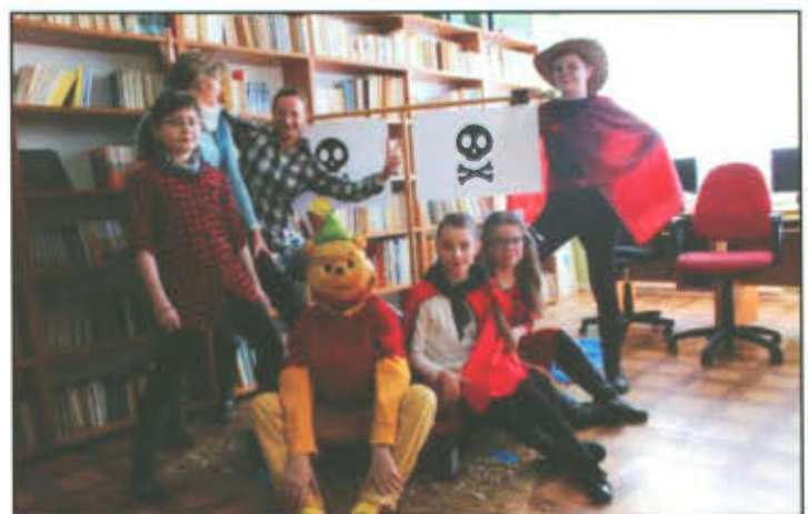
Drzwi otwarte w Szkole Podstawowej w Lipnie.