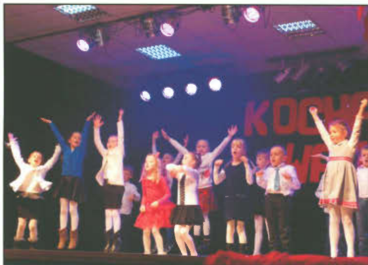
Kolorowe Dni w Przedszkolu w Lipnie.

Kocham mocno Babcię, Dziadka To nie żarty moi mili Dzisiaj im życzenia składam By sto latek jeszcze żyli.