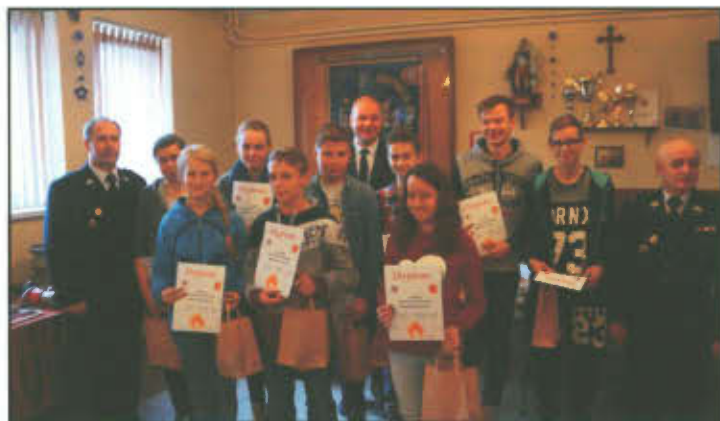
Wręczenie upominków i pamiątkowych dyplomów.