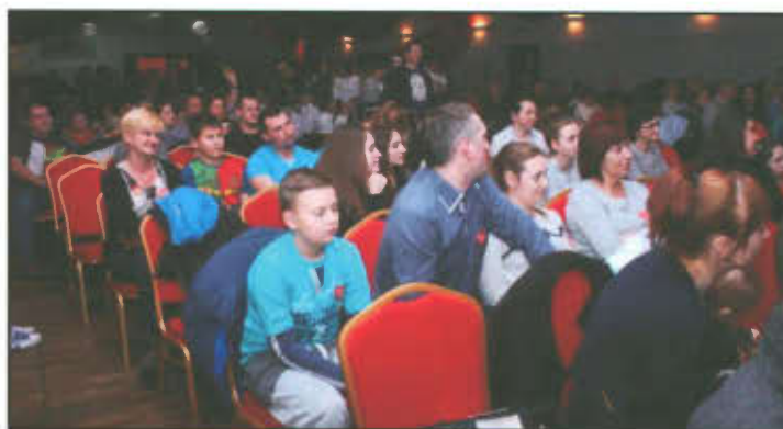
24 Finał WOŚP w Lipnie.