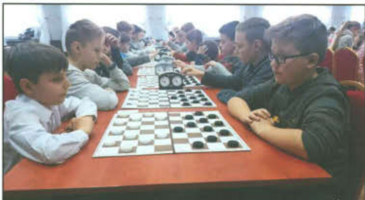
Mistrzostwa Powiatu Leszczyńskiego i miasta Leszna w warcabach.