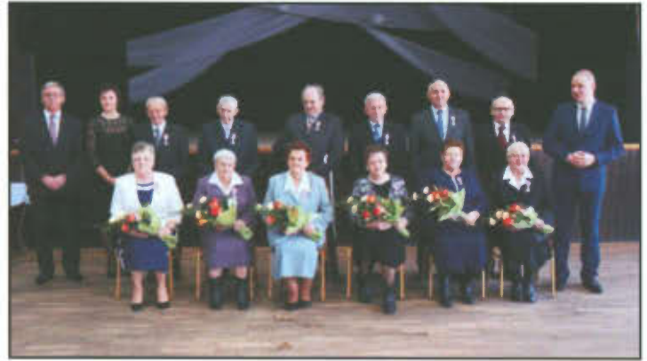
Pary obchodzące Jubileusz 50-lecia pożycia małżeńskiego w towarzystwie Wójta Gminy Lipno, Przewodniczącego Rady Gminy Lipno i Kierownik USC.