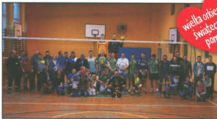
Turniej Piłki Siatkowej o Puchar Przewodniczącego Rady Gminy Lipno.