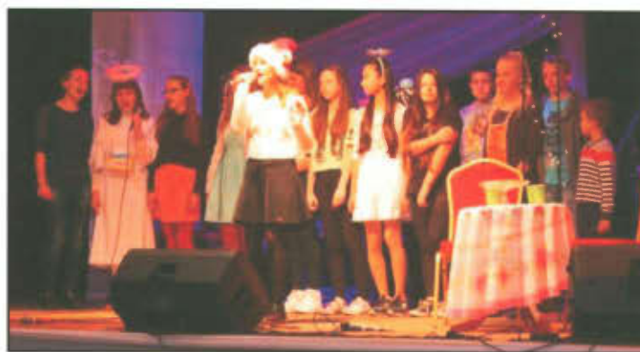
Występy w sali Gminnego Ośrodka Kultury w Lipnie.