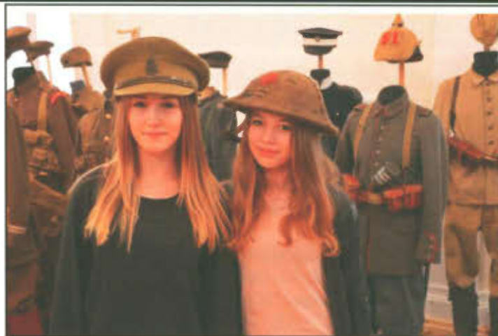
Uczennice Gimnazjum w Lipnie przy ekspozycji poświęconej I Wojnie Światowej.

Drugim etapem lekcji muzealnej było zwiedzanie wystawy poświęconej I Wojnie Światowej. Ekspozycja składa się z blisko 40 plansz i prezentuje najważniejsze wydarzenia z teatru działań I Wojny Światowej, z perspektywy południowozachodniej Wielkopolski. Wystawę zilustrowano szeregiem dokumentów archiwalnych, plakatów propagandowych, komunikatów i odezwo do ludności, zdjęć, czy plakatów zachęcających do wplat w ramach kolejnych pożyczek wojennych. Wystawę uzupełnia zbiór przeszło 100 oryginalnych eksponatów, pocztówek, plakatów i dokumentów z epoki, mundury wraz z oporządzeniem bojowym żołnierzy wojsk państw centralnych i Ententy. Uczniowie mogli dotknąć, a nawet przymierzyć zgromadzone na ekspozycji m.in. hełmy, czapki i mundury żołnierzy brytyjskich, francuskich czy też niemieckich. Można było zobaczyć pociski karabinowe i artyleryjskie, lance kawaleryjskie, szable, pistolety, manierki, odznaki bojowe, itp. Na ekspozycji niezwykle interesująco prezentuje się część