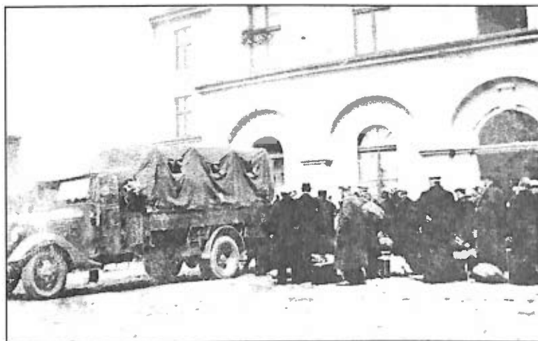
3. Wywóz księży z Lubinia do Fortu VII w Poznaniu (1940 r.)