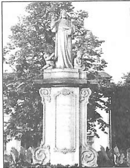
13. Pomnik Serca Jezusowego w Kościanie.