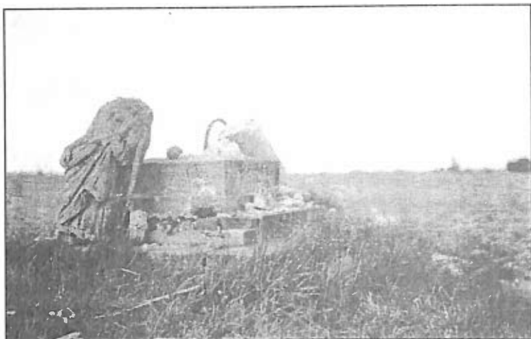
10. Pomnik zniszczony w Czempiniu.