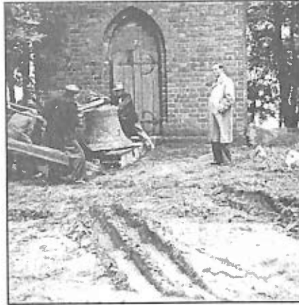
12. Rabunek dzwonów z Wilkowa Polskiego.