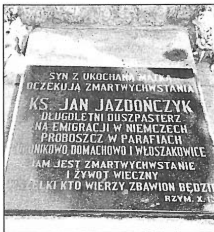
17. Tablica na grobie w Bronikowie.