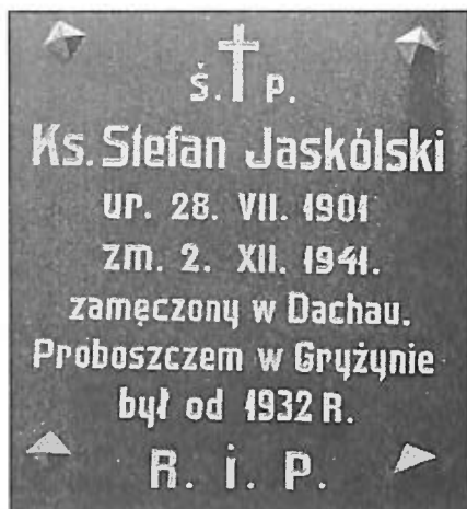
16. Tablica na kościele w Gryźynie.