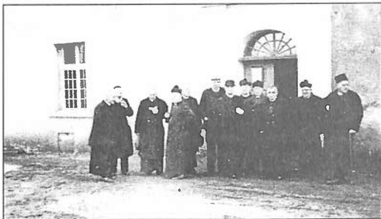
2. Księża internowani w klasztorze w Lubiniu.