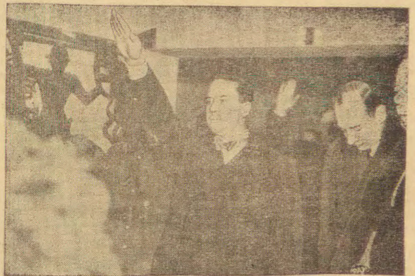
Min. Ciano oddaje hołd pamięci Marsz. Józefa Piłsudskiego na Wawelu.