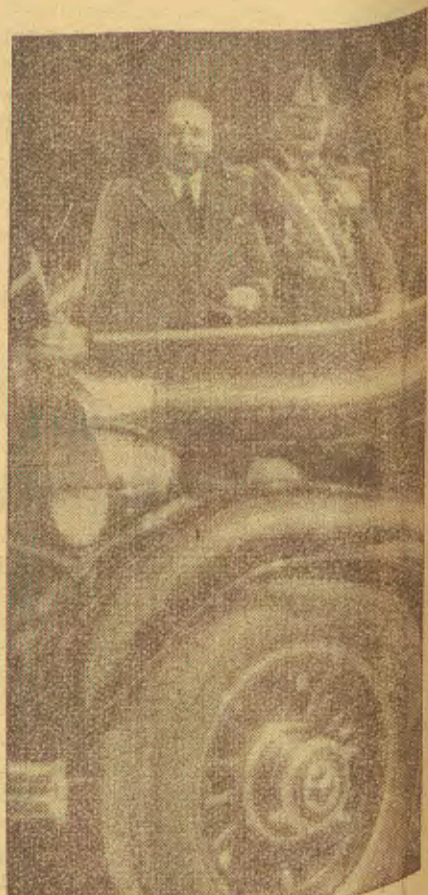
Zdjęcie przedstawia prezydenta Austrii dr. Miklasa w towarzystwie regenta Królestwa Węgier w Budapeszcie, dokąd przybył Miklas przed niedawnym czasem przybył z wizytą, witany z niezwykle uroczystym ceremoniałem.