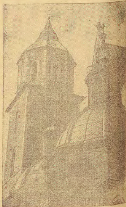
Wieża Srebrnych Dzwonów w Katedrze Wawelskiej w Krakowie

KTO KUPUJE U ŻYDÓW — POPELNIĄ GRZECH WOBEC PRZYSZŁOŚCI NASZEGO NARODU.