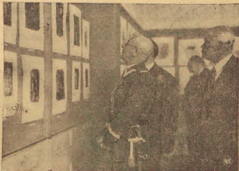
W dniu 3 czerwca w gmachu Akademii Sztuk Pięknych na Wybrzeżu Kościuszkowskim w Warszawie została otwarta wystawa prac studentów Akademii. Wernisaż wystawy zaszczylił swą obecnością P. Marszałek Smigły-Rydz, który z zainteresowaniem zwiedził całą wystawę.

„Wśród patriotów słowackich panuje przekonanie, iż w związku z powierzeniem b. min. Sidorowi ważnej misji politycznej, ten ostatni udać ma się do Polski celem przeprowadzenia doniosłych rozmów”.