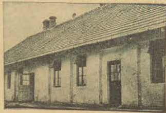
Tak było przed rokiem

To właściwie nie ambulatorium, ale prawie że kompletnie wyposażony ośrodek zdrowia. Wspaniale urządzone nowoczesny budynek, liczny personel lekarski, gabinet elektroczłowieczy itp. nieodzowne urządzenia, stawiają to ambulatorium na równi, a może i wy-