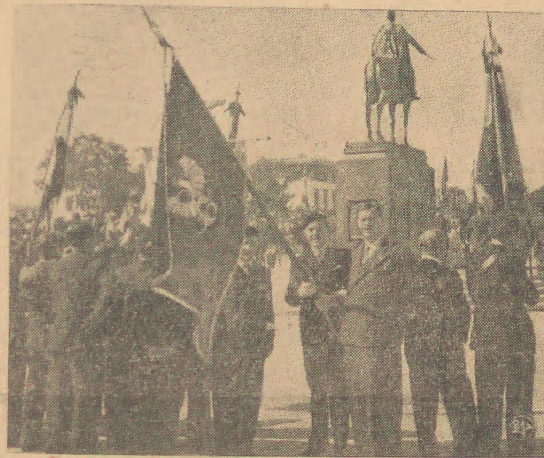
Delegacja b. kombatantów polskich ze sztandarem, podczas uroczystego odsłonięcia pomnika Marsz. Lyautey w Casablance.

Sokoła Macierzy odbyła się akademja, urządzona dla uczestników Obrony Lwowa.