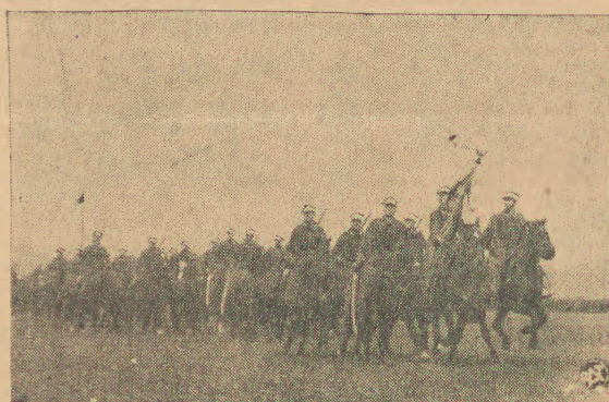
Ułani podczas defilady w dniu 11 listopada w Cieszynie.

wszelkich posiadłości jak: kapitału, należności lub nieruchomości za granicą spowodowały wydanie powyższego dekretu. Umożliwi to odnośnym obywatelom lojalnie wypełnienie wspomnianego zarządzenia, bo mocą tego dekretu władze będą umarzały winy natury dewizowej i skarbowej za czyny poprzednio popełnione.