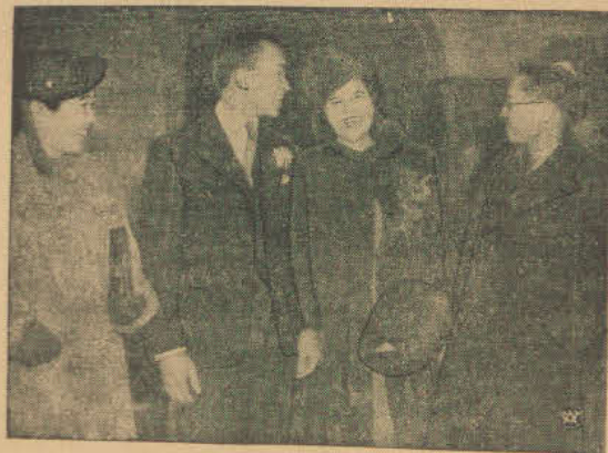
W Londynie odbył się ślub księcia syjamskiego Chirasakti z księżniczką syjamską Sukhodaya. — Na zdjęciu nowoślubiona księżna z syjamem (w środku).

Rurociąg posiada wybitne znaczenie strategiczne, gdyż wobec braku linii kolejowych w Azji środkowej skoncentrowany tu został olbrzymi park samochodowy dla zmotoryzowanych jednostek armii czerwonej. Rurociąg ułatwi sprawne zaopatrzenie tych jednostek w materiały pędne.