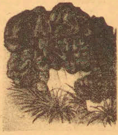
Grzyby t. zw. „Morchle”.

Na rynku leszczyńskim ukazały się już pierwsze grzyby wiosenne, powszechnie znane w okolicy Leszna. Mowa tu o grzybach smardzach i plestrzenicach. Podobieństwo tych dwóch grzybów do siebie