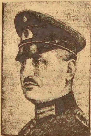
Wróg katolicyzmu von Eppa.

ki, równocześnie w różnych punktach miasta pojawiły się grupy ludzi, wznoszące okrzyki: „Nie mamy pieniędzy dla przemytników dewizowych”. „Hańba zdrajcom”, a w różnych częściach miasta doszło do bójek. W następstwie tego monachijski prefekt policji na rozkaz von Eppa aresztował dwóch księży”.