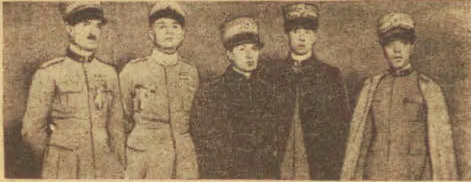
Sztab oficerów włoskich w Afryce.

Abisynja zabiega o pomoc Anglii a włosi codziennie transportują żołnierzy.