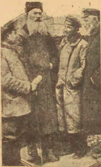
Żydzi komisarzami Z. S. R. R.

gospodarstw podniosła się. Ziemię orną obsługuje 27 traktorów, 32 kultywatorów, i młockarni.