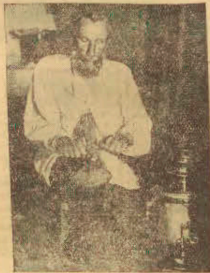
Lekarz — Polak sam rozpala ognisko.

Gdy w Sowietach rzucono hasło tworzenia autonomicznych rejonów powstał w r. 1926 polski okręg samorządowy im. Marchlewskiego. Liczba mieszkańców tego okręgu dochodzi do 51.133, z czego jest Polaków 53 proc.