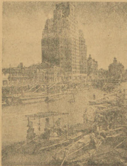
Widok na nowoczesne drapacze chmur w Szanghaju