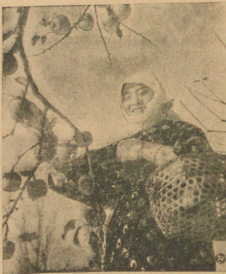
Obfity i smaczny plon owocodajnych drzew japońskich

wienia przez wdowę dwoje dzieci w domu Łasoniowa zmuszona utrzymywać siebie i rodzinę, pozostawiła dzieci w zamkniętej izbie i sama udała się do pracy. Sąsiedzi zauważyli wprawdzie wydobywający się dym, lecz pomoc ich po wyłamaniu drzwi okazała się spóźniona. Sprawą tą zainteresowała się policja.