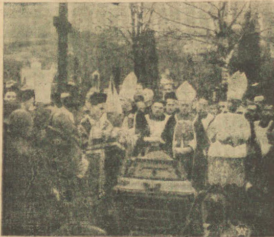
We Lwowie odbył się pogrzeb wielkiego kapłana — patrioty śp. metropolity Teodorowicza. — Na zdjęciu trumna ze zwłokami ks. arcybiskupa Teodorowicza nad grobem na Cmentarzu Obrońców Lwowa.

ra jednostki i społeczeństw, odnowił ofiarę poświęcenia swego życia dla pokoju świata i dla dobra duchownego i materialnego ludu oraz udzielił błogosławieństwa apostołskiego.