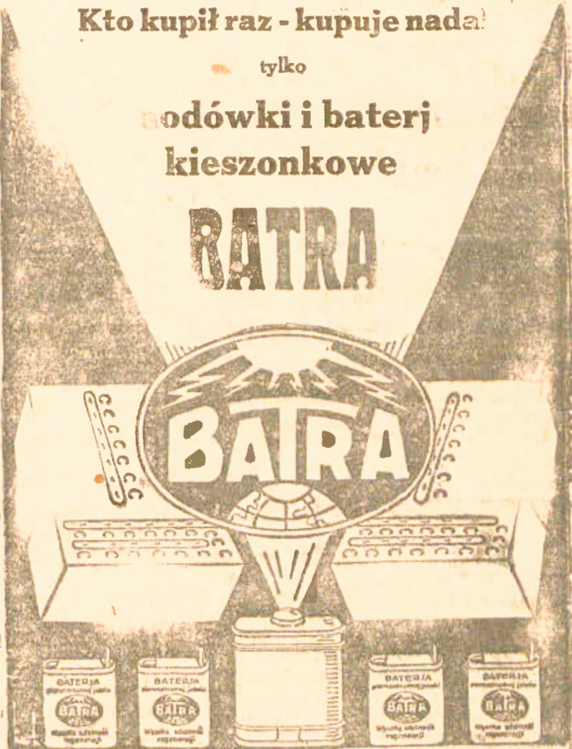
FABRYKA ELEMENTÓW I BATERJI BATRA, POZNAŃ