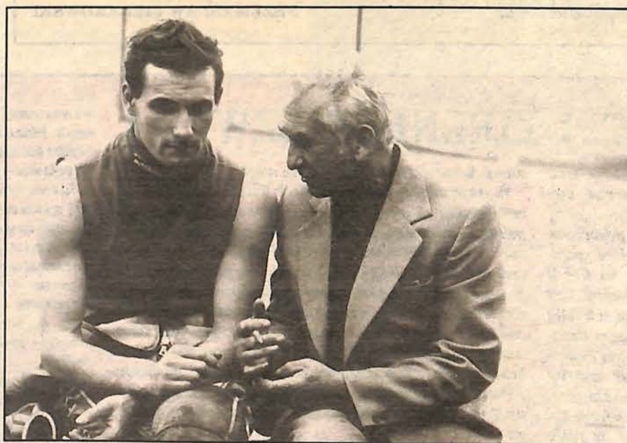
„Wygląda na to, że team Gollobów został ze swoją porażką sam...”