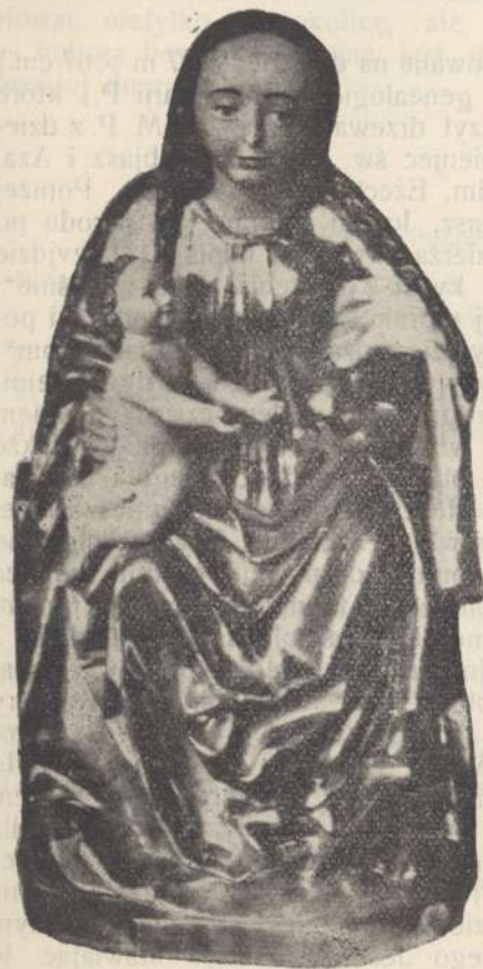
Madonna z Dzieciątkiem XVI w. z fary gostyńskiej

Podobne miednice z „Zwiastowaniem“ posiada kościół w Śremie i Jarocinie.