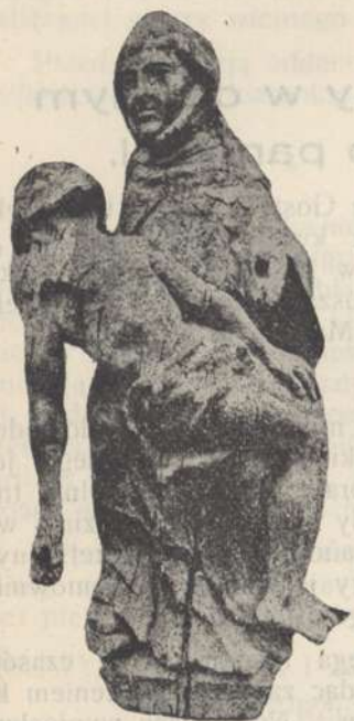
Matka Boska Bolesna w farze gostyńskiej

znaczenie miała rzeźba, czy stała kiedyś w kościółku świętogórskim, czy w farze, jako wizerunek nieszporny (Vesperbild), czy stała przy drodze, niewiadomo. Również niewiadomo, jak dostała się do kościoła farnego. Dość, że jest bardzo dawna i pochodzi z XV wieku. Sprawę tę rozświetlić będzie zadaniem ekspertów, badających rzeźbę. W każdym razie jest to czcigodny zabytek kultu N. Panny w Gostyniu, prawie nikomu nieznaną a wyrosłą na gruncie nabożeństwa Gostynian do M. Boskiej Bolesnej.