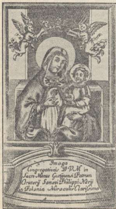
Stary sztych Matki B. Gostyńskiej