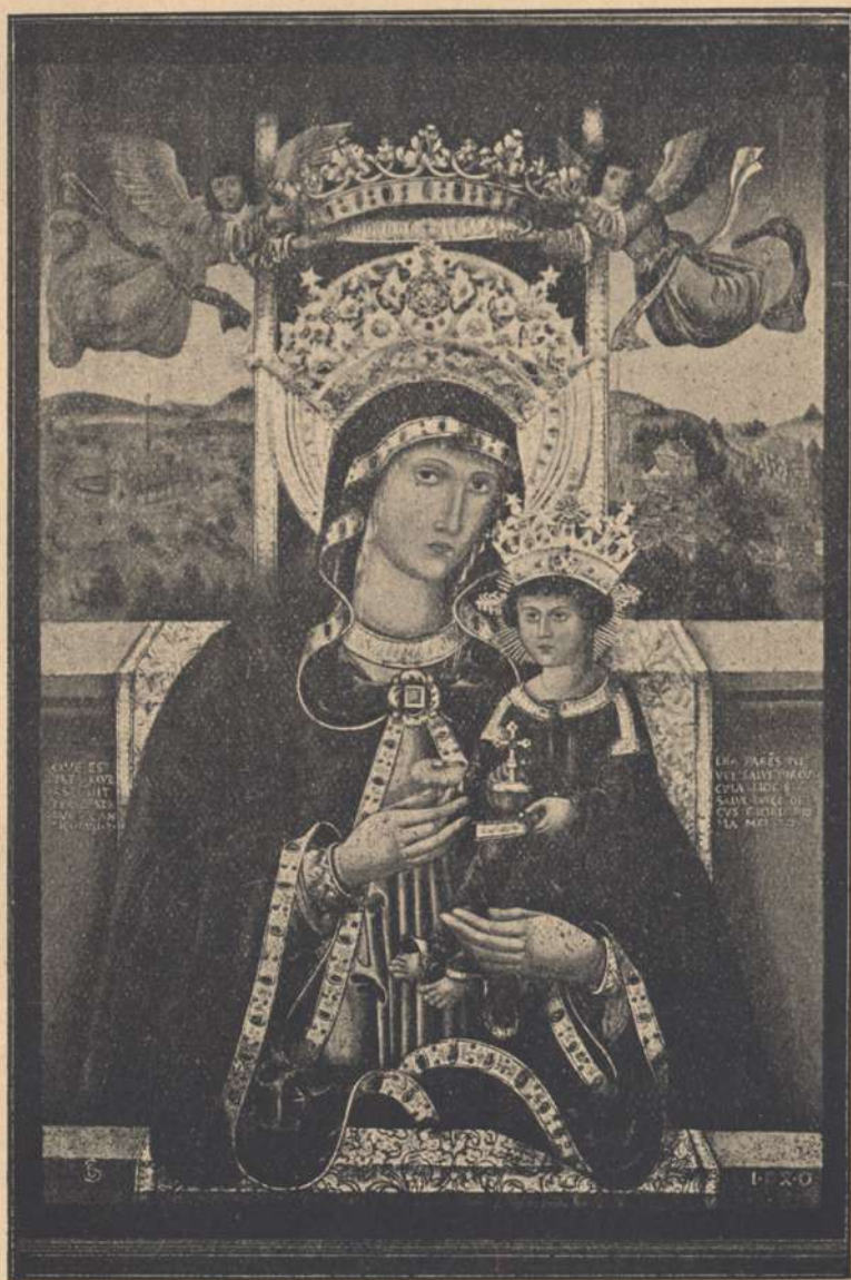
Cudowny Obraz Matki Boskiej na Świętej Górze pod Gostyniem