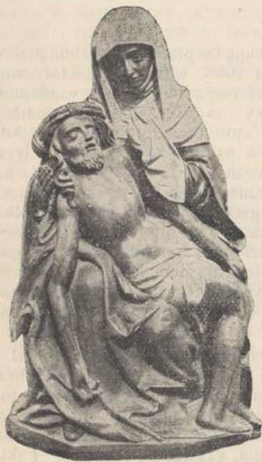
Matka Boska Bolesna na Świętej Górze

z głównych siedlisk i twierdz odszczepieńców polskich. List legata papieskiego, Franciszka Comendoniego, z datą 1. 10. 1565, a wysłany do św. Karola Boromeusza, wspomina o zjeździe lustrów odbytym w Gostyniu, na którym starano się przeprowadzić ugodę z waldensami, lecz bezskutecznie. Nawrócenie się dziedzica gostyńskiego położyło nietylko tamę dalszemu rozwojowi sekty, ale stało się początkiem ich upadku. Nic więc dziwnego, że św. Góra wraz z kaplicą, wybudowaną w r. 1512, nietylko, że nie doznała opieki, ale stała się przedmiotem prześladowania ze strony heretyków. Potwierdzają one prawdziwość kilku legend, odnoszących się do figury Matki Boskiej Bolesnej i wizerunku Pana Jezusa na krzyżu. Wiadomość o nich czerpię z owych