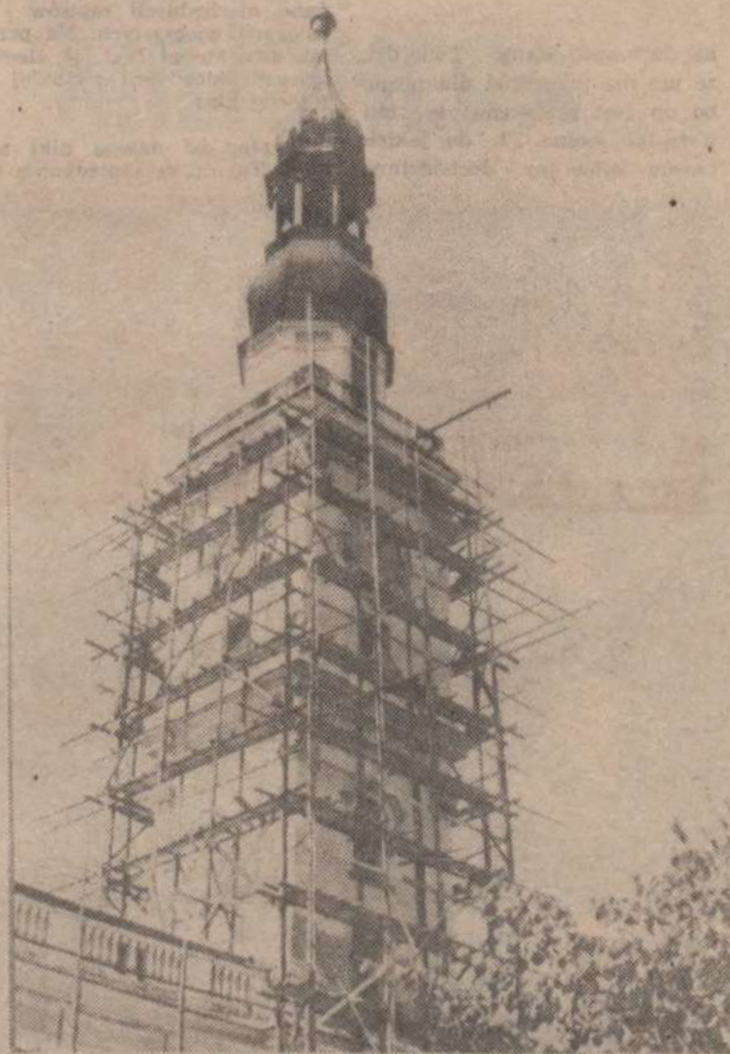
Leszczyński Ratusz w trakcie kosmetycznych zabiegów.

Mieszkańcy Srok o budowie domu kultury zdecydowali w 1978 r. Zdali sobie jednak sprawę, że nie będzie to prosta sprawa. Każde tego typu przedsięwzięcie wymaga sporo zabiegów organizacyjnych. Wieś uradziła, iż należy na przewod-