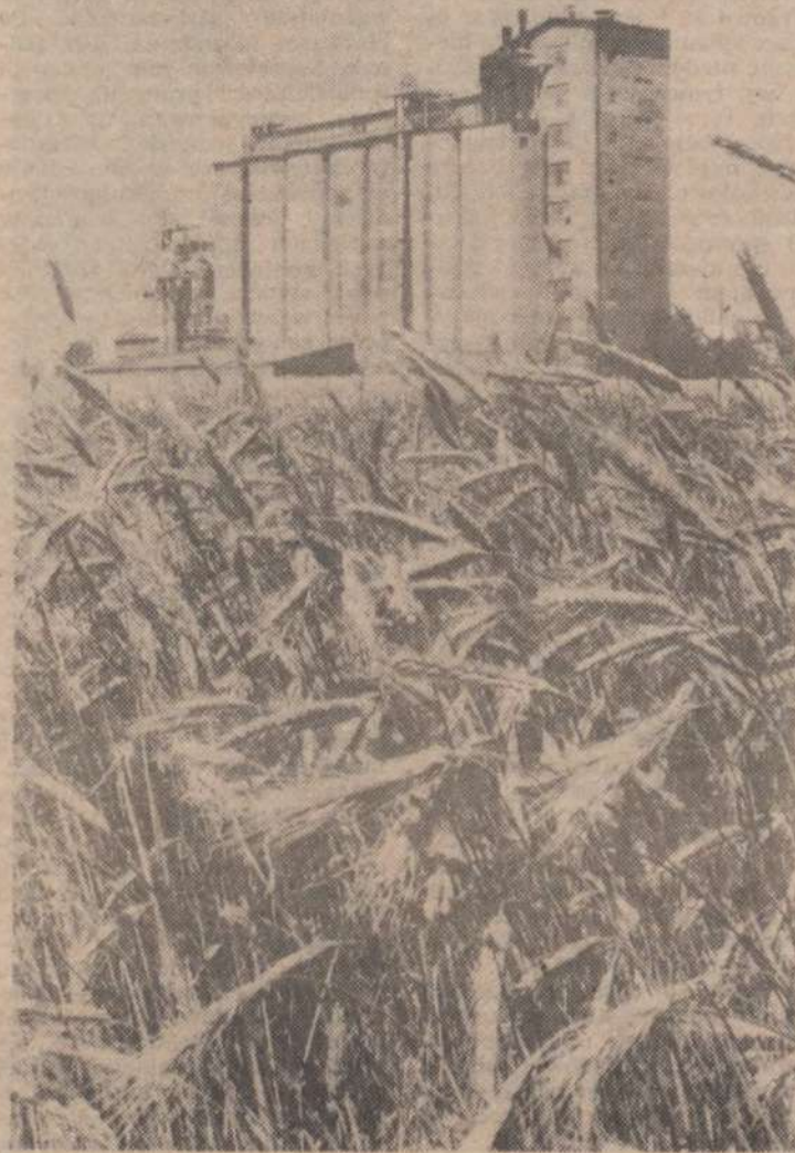
Od kłosów aż rojno, wszystkie gęsto wypełnione ziarnem. Gdzie trafią — do elewatora, czy na posadzkę baraku?

W przeciągu minionego roku nie przybyło ani jednego z prawdziwego zdarzenia magazynu zbożowego. A szacunkowo obliczane potrzeby są wyższe jak w poprzednie żniwa. Już choćby sam rzepak pojawi się prawdopodobnie w dawno niespotykanej masie, jak się przewiduje 23 tys. t. Areal uprawy tej rośliny wzrósł nieznacznie, ale plony zapowiadają się tak wyjątkowo dobrze. 12 tys. t. rzepaku przejmą od razu zakłady w Kruszewicy. Jednak pozo-