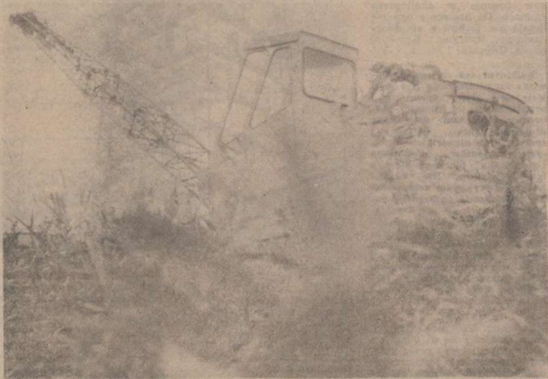
„Koparka stoi w chwastach”

Chyba do tego, że panowie władcy znów rządzą. Bo co in- nego rząd i partia, a co inne- go kacyki na gminnym szcze- blu. To jest śmiechu waite i warto, tak się mnie bynajmniej wydaje — żeby przyjechała te- lewizja i to nagrała, i naświe- tliła, jak to się dzieje w Jer- ce, a przecież jest to duża wioska...”.