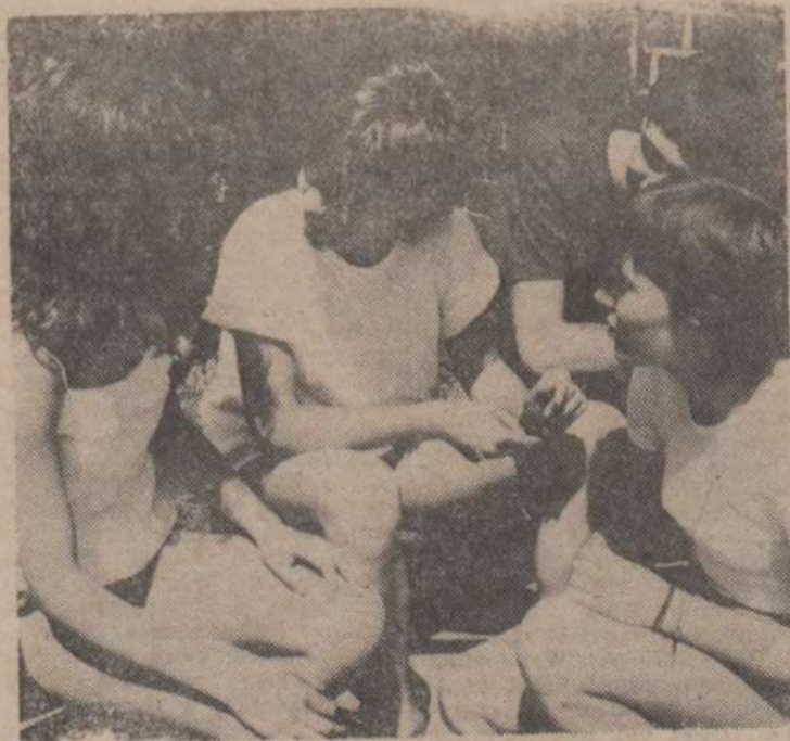
Po każdym dniu wrażenia trzeba omówić w gronie przyjaciół.