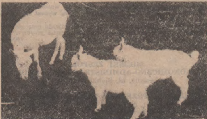
Sensację wśród mieszkańców wojewódzkiego grodu wzbudza koźca rodzina, żyjąca w Lesznie na działce przy ul. 55 Pułku Piechoty. Najwięcej radości przysparza ona dzieciom z pobliskiego przedszkola, dla których koźca jest już zwierzęciem egzotycznym.