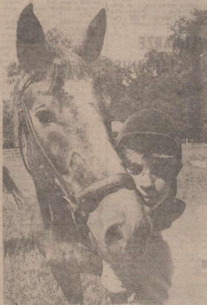
Mój przyjaciel koń.