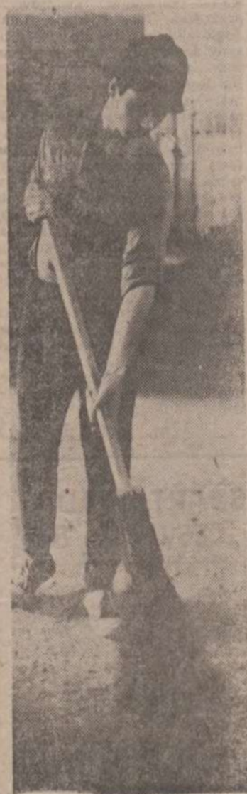
W stajniach musi panować wzorowa czystość.