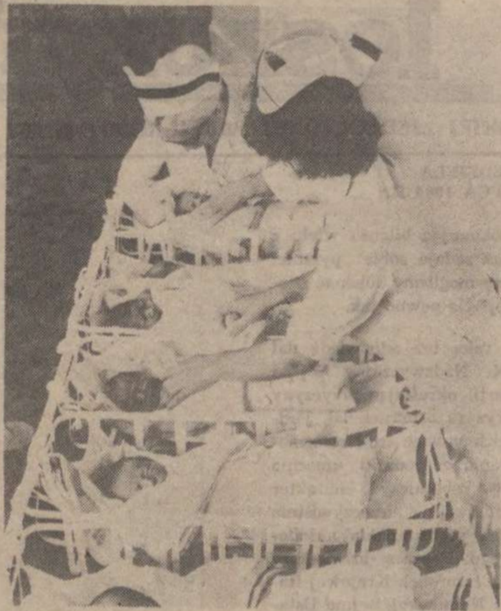
W ubiegłym roku zanotowano najniższy w naszej historii wskaźnik umieralności niemowląt 19,3 promile.