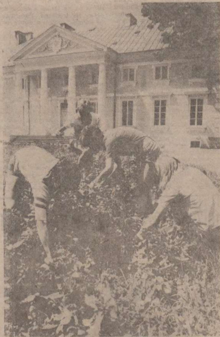
Prace społeczne przy porządkowaniu otoczenia zabytkowego pałacu.