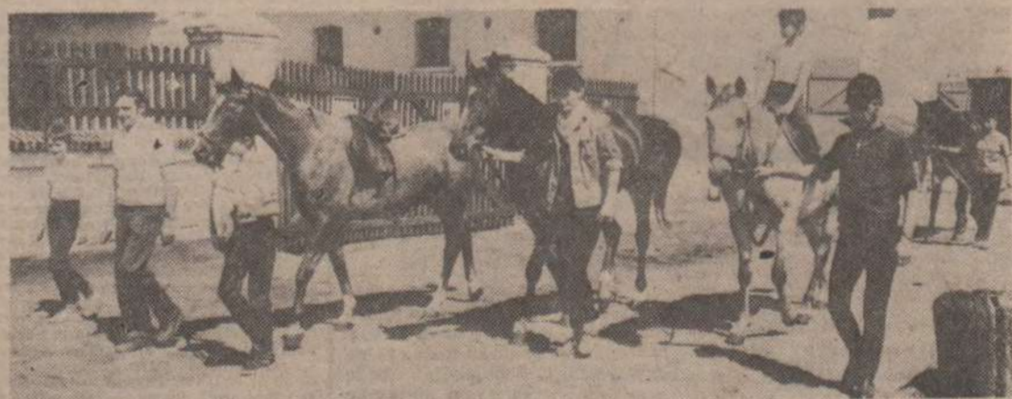
W drodze na trening.